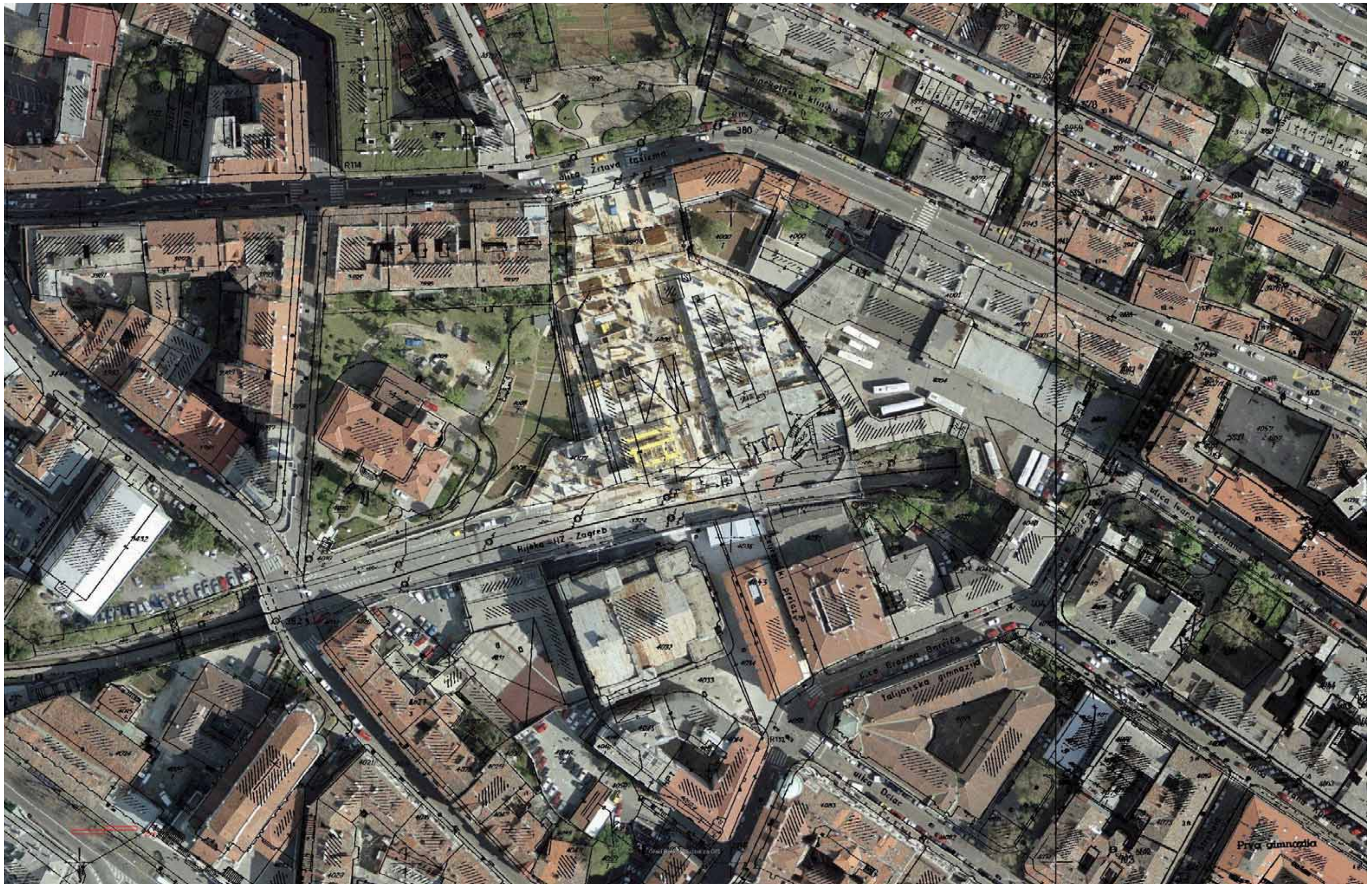
Grad Rijeka, digitalni ortofoto 10cm 27. studeni 2007.