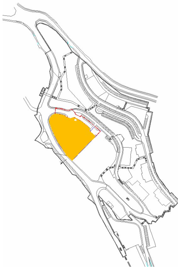
SLIKA 3. –Obuhvat Plana unutar važećeg DPU-a dijela područja Škurinjska Draga

Površina obuhvata Plana iznosi oko 0,90 ha.