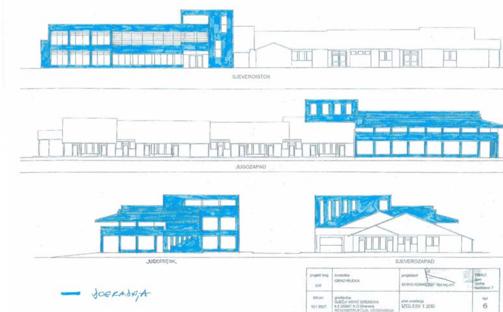
Slika 2. Dogradnja PPO-a Drenova