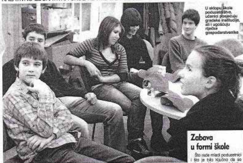
U sklopu škole poduzetništva, učenici posjećuju gradske institucije, ali i ugostuju rječke gospodarstvenike