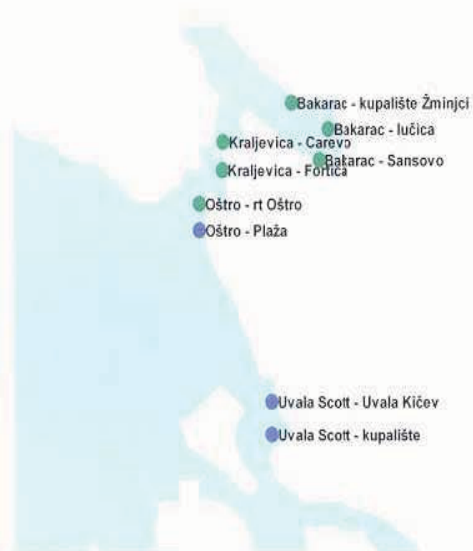
Slika 4. Kakvoća mora na području Bakarac – Uvala Scott u 2008. godini.

Zbog bakteriološkog onečišćenja priobalne vruđe kod hotela Park, prisutno od 2005.godine, početkom ljeta 2008. godine obalno je more u okolici vruđe ograđeno plutačama i postavljena je tabla zabrane kupanja. Tijekom ljeta 2008.godine vršila su se redovita ispitivanja kakvoće mora na točki «kupalište hotela Park» koja se nalazi izvan ograđenog područja oko 15-20 m od obale i ti su se rezultati objavljivali za javnost.