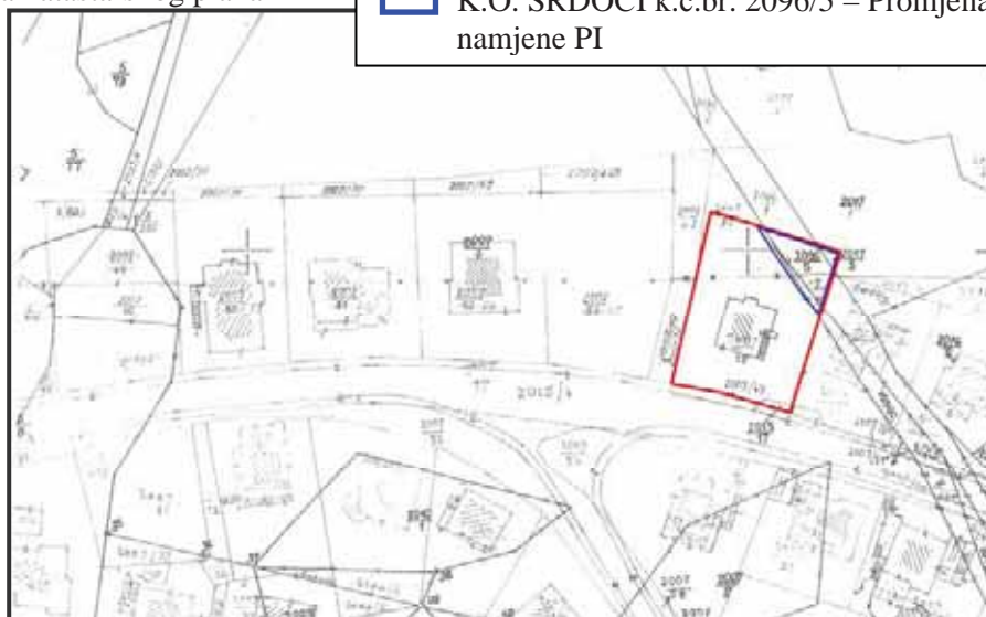
Kopija katastarskog plana