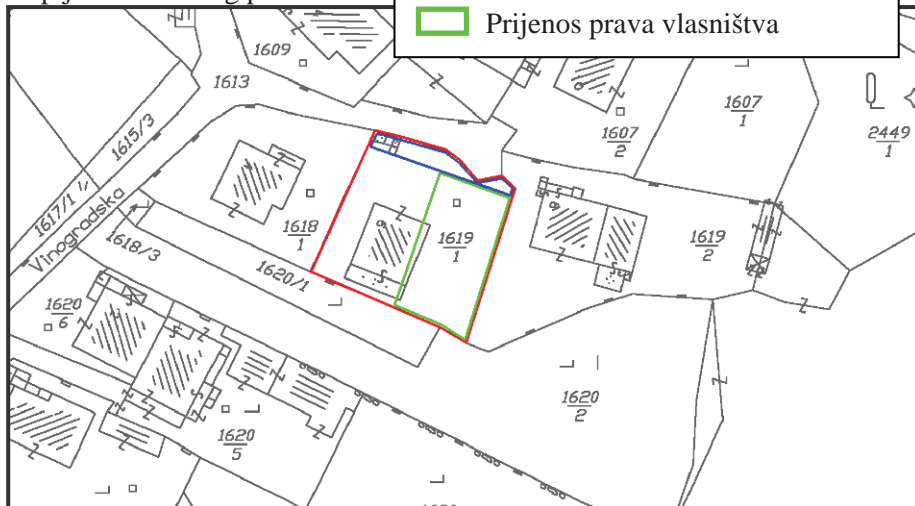
Kopija katastarskog plana