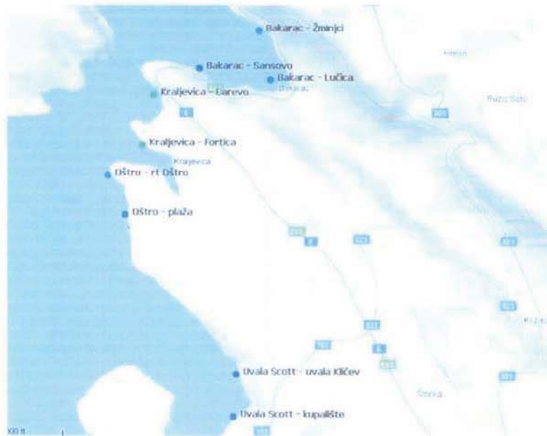
Slika 5. Kakvoća mora na području Bakarca- Kraljevice u 2009. godini