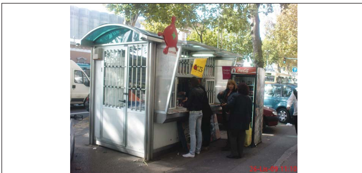
fotografija prikazuje stanje lokacije za postavu privremenog objekta iz jeseni 2009. godine