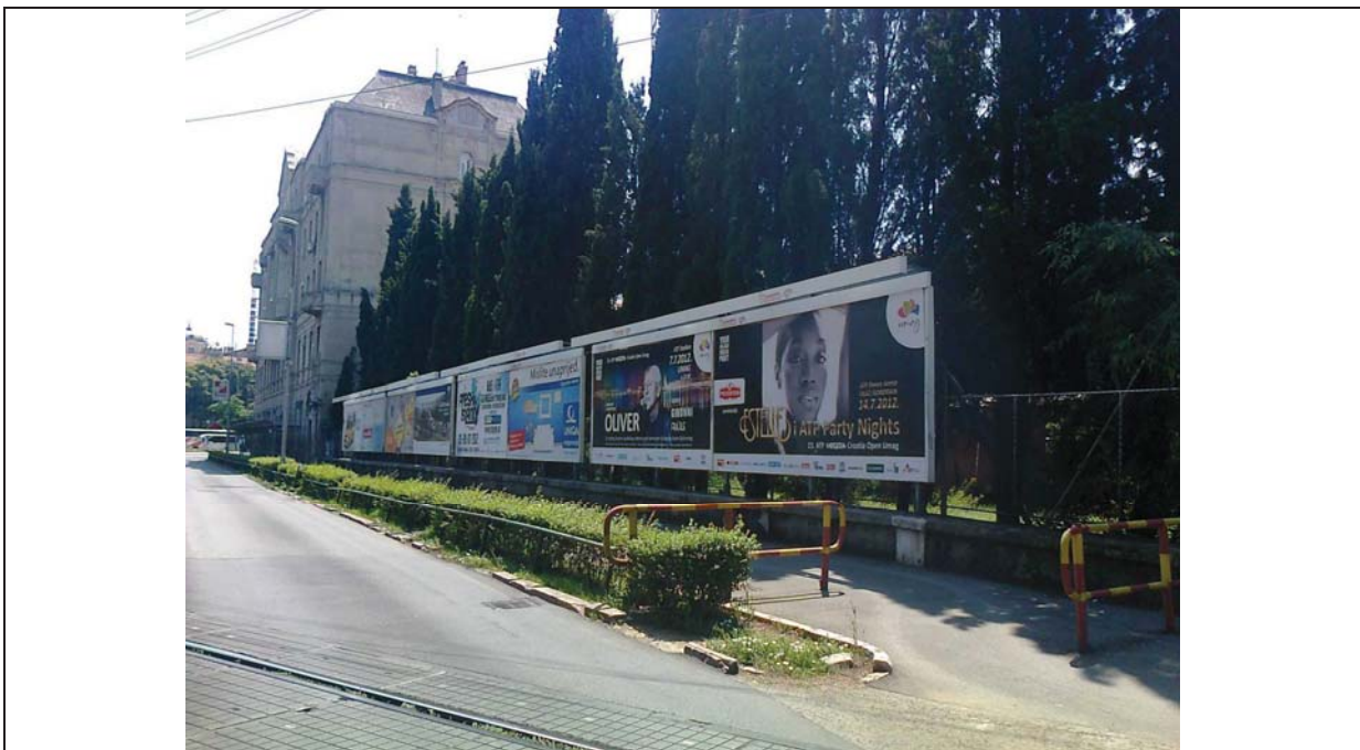
Fotografija prikazuje stanje iz 2012.godine