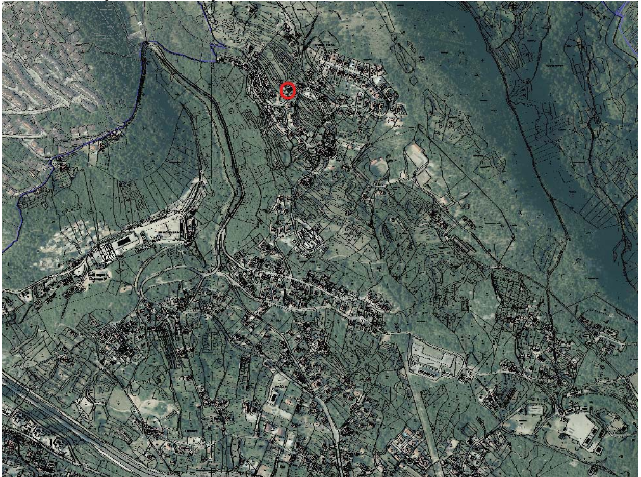
Kopija katastarskog plana