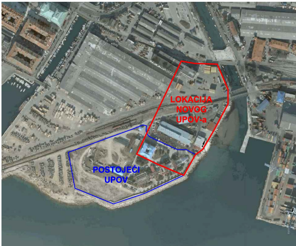
Slika 2. Prijedlog nove lokacije UPOV-a Rijeka