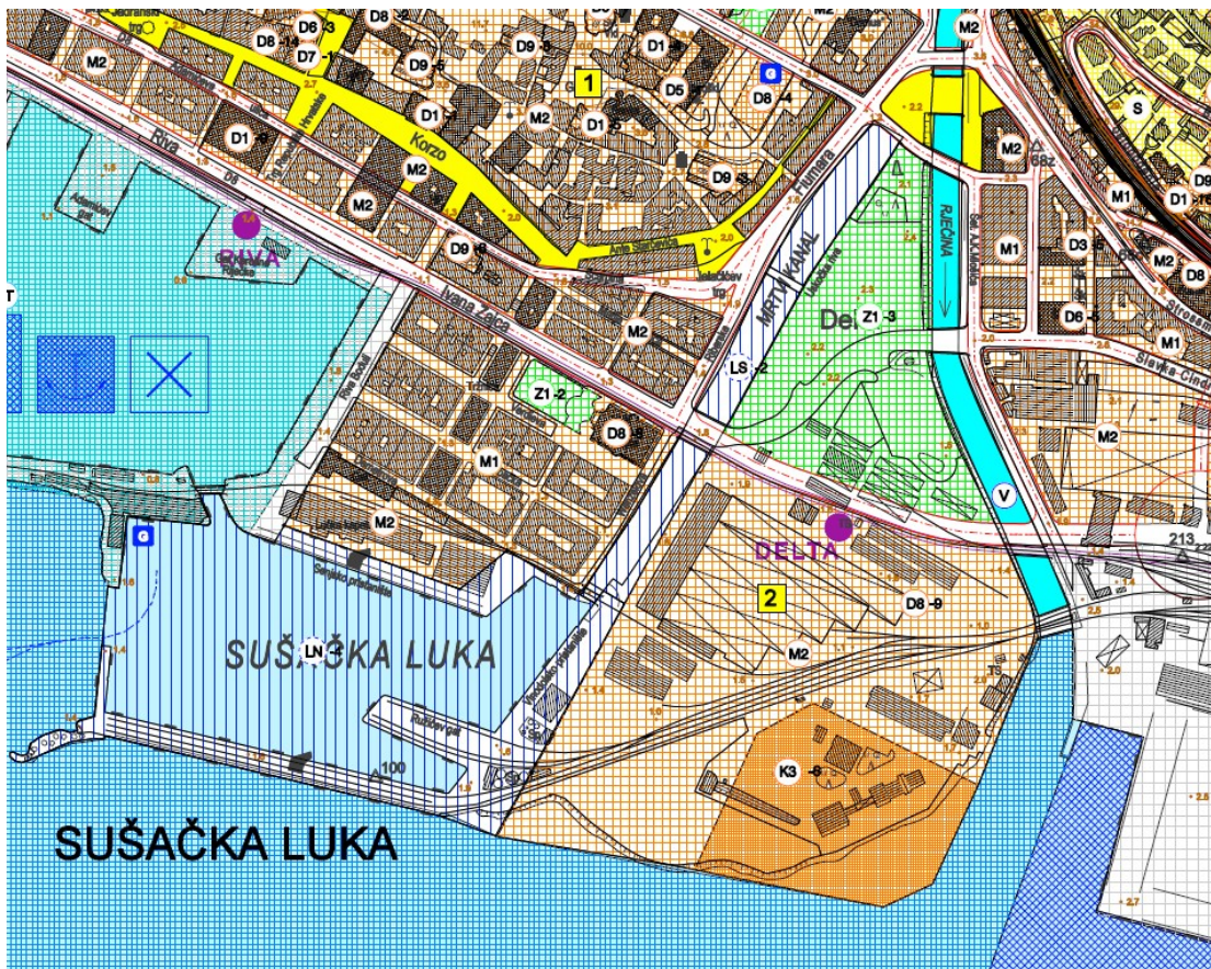
Slika 1. Izvadak iz Generalnog urbanističkog plana grada Rijeke (SN 7/07 i 14/13) - kartografski prikaz Korištenje i namjena prostora

Kako se optimalna lokacija, sukladno GUP-u, nalazi djelomično izvan površine utvrđene za gradnju i razvoj UPOV-a (K3-8), potrebno je izvršiti izmjenu GUP-a na način da se gradnja omogući na odabranoj lokaciji.