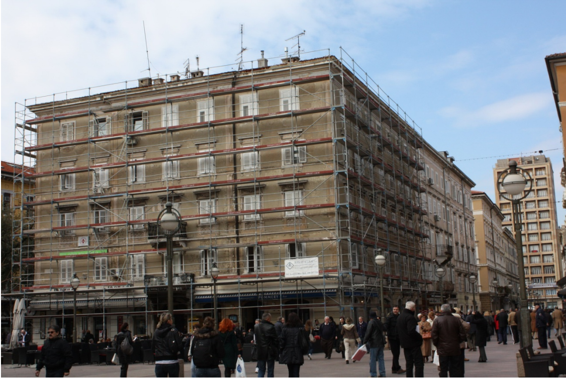
Ljudevita Matešića 17- dovršeni su radovi sanacije i obnove koje je Grad Rijeka sufinancirao u iznosu od 117.674,10 kn.