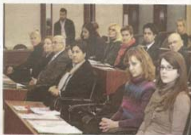
5 tribine »Hrabrost je odabrati nenasilje«

S činjenicom da je maloljetnička delinkvencija u pa-