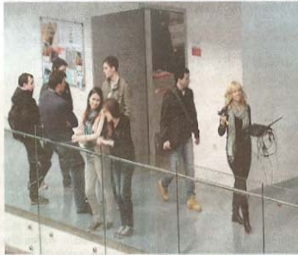
Bogat program u povodu 10. obljetnice Zaklade Sveučilišta

formans »Artikulacija« koji propituje identitete izvođača unutar performativnog čina djelovanja i akcije kroz prizmu performans arta, suvremenog plesa, improvizacije i novih medija. Obilježavanje prvog jubileja nastavit će se 19. travnja organizacijom akcije mjerenja tlaka i šećera u krvi građana na Korzu, a toj će se akciji pridružiti i studenti Medicinskog fakulteta Sveučilišta u Rijeci okupljeni u Udrugu FOSS, dok će se obilježavanje jubileja okončati 6. srpnja humanitarnim koncertom »Hrabrost je odabrati nenasilje« koji 25. ožujka ove godine nije održan zbog loših vremenskih prilika. Koncert će se prema prvotnom planu održati u HKD-u Sušak, a ulaznice koje su građani kupili za odgođeni koncert u ožujku vrijedit će na koncertu u srpnju. (I. Š. K.)