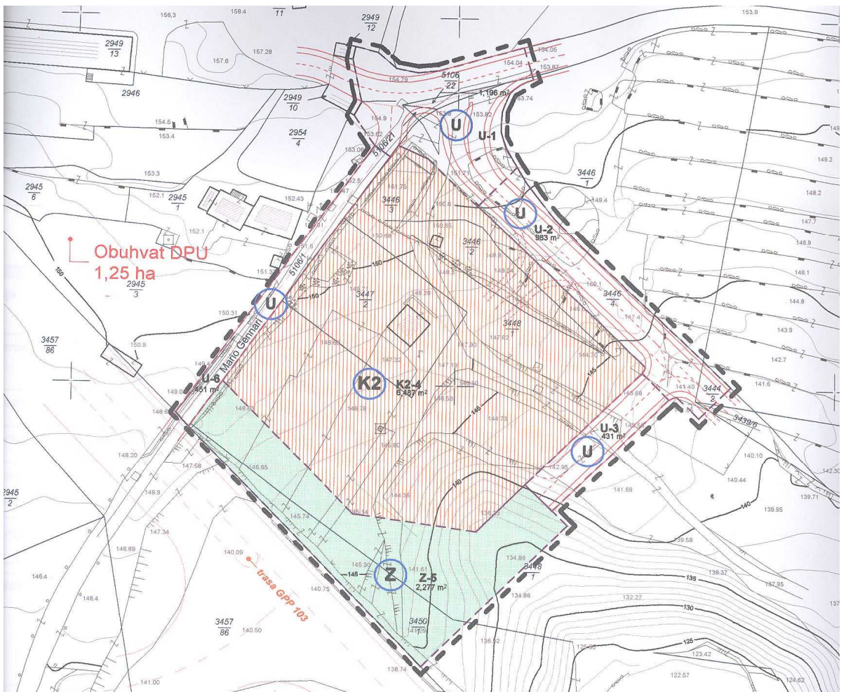
Izvod iz kartografskog prikaza br.1. Detaljna namjena površina DPU radno-servisne zone na Rujevici