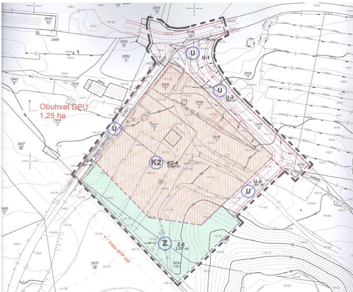
Izvod iz kartografskog prikaza br.1. Detaljna namjena površina DPU radno-servisne zone na Rujevici