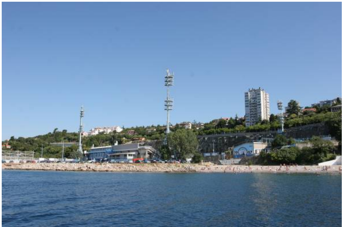
Slika 1. - Pogled na stadion Kantrida, parkiralište i dio plaže Igralište

Povodom iskazanog interesa za ulaganje u rekonstrukciju sportske infrastrukture, analizirani su razni aspekti ove teme. Sukladno prethodno navedenom, za gradnju novih građevina na širem području stadiona Kantrida, potrebno je izraditi urbanistički plan uređenja kojim bi se definirali mogući novi sportski i prateći sadržaji, ali i osmišljavanje i uređenje obalnog područja namijenjenog rekreaciji.