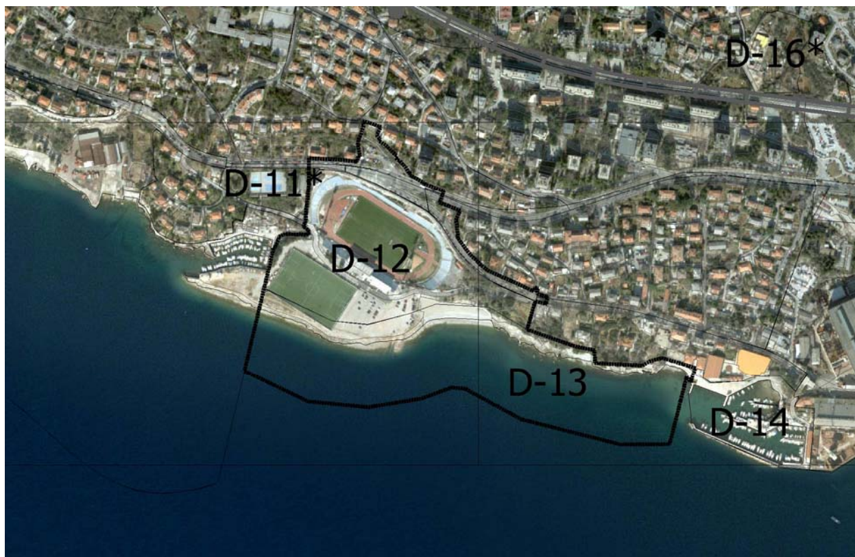
Slika 3. – Prijedlog granice obuhvata Plana prikazan na orto-foto snimci

Površina obuhvata Plana iznosi oko 13,95 ha i to kopneni dio 7,45 ha, dok morski dio iznosi 6,50 ha.