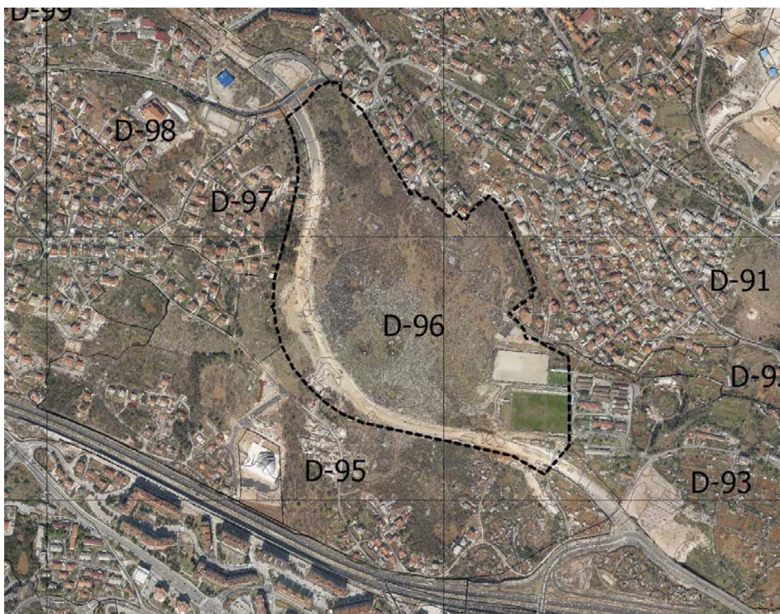
Slika 2. – Prijedlog granice obuhvata Plana prikazan na orto-foto snimci