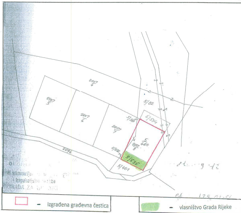
□ - izgrađena građevna čestica