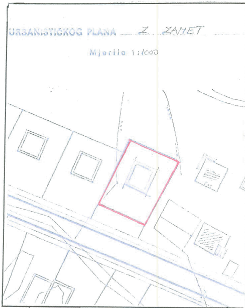
□ građevna čestica u vrijeme dodjele zemljišta