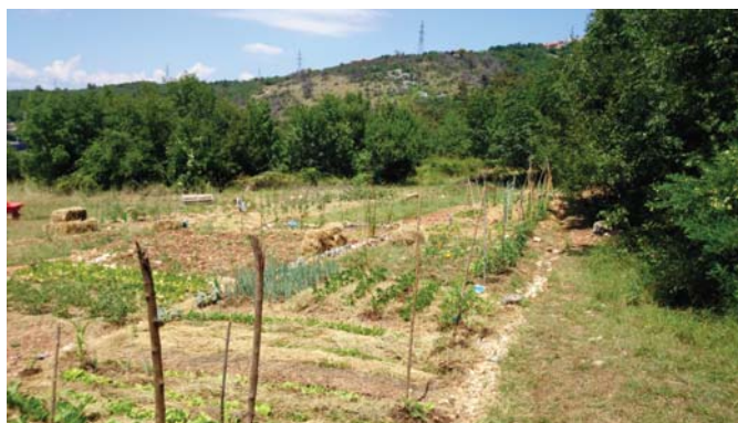
Slika 3. Pogled na ZUV, lipanj 2014. (Boris Bilić)