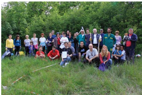
Slika 1. Dio sudionika Zelene čistke 26. travnja 2014. na Zelenom putu (Petra Aničić)