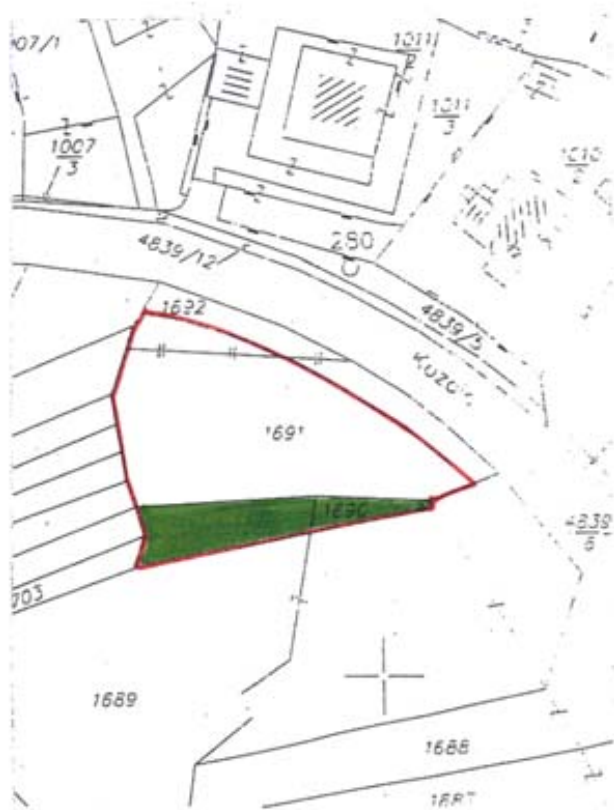
KOPIJA GRUNTOVNOG PLANA M 1:1000