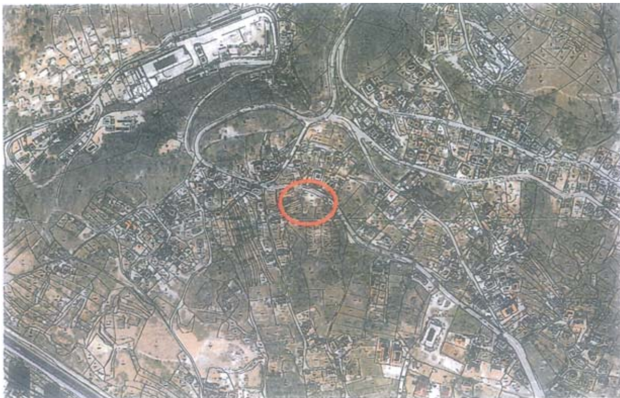
KOPIJA KATASTARSKOG PLANA M 1:1000