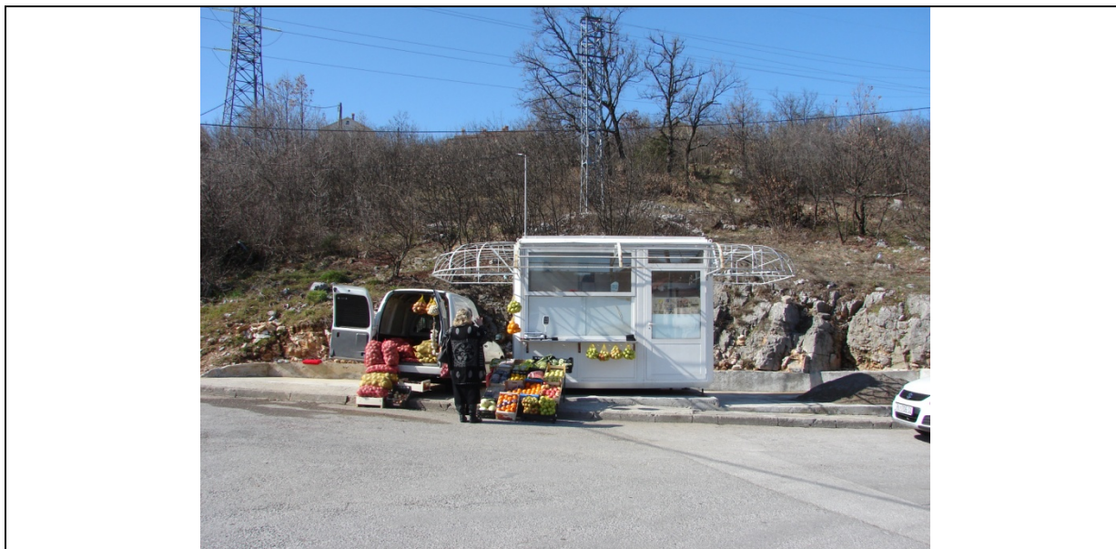
fotografija prikazuje stanje lokacije za postavu privremenog objekta iz ožujka 2013. godine