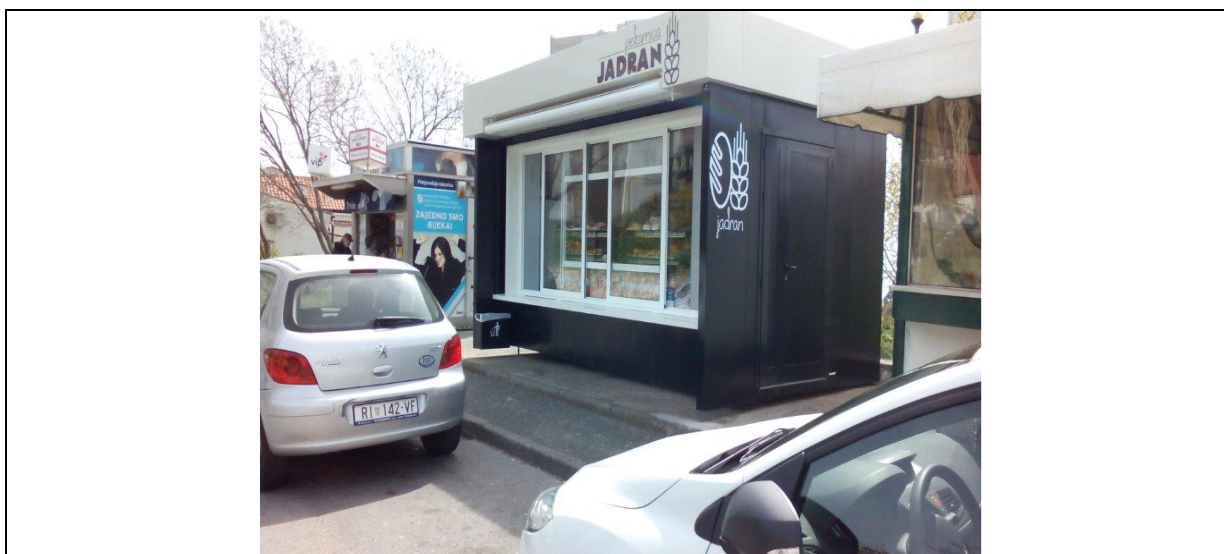
fotografija prikazuje stanje lokacije za postavu privremenog objekta iz jeseni 2009. godine