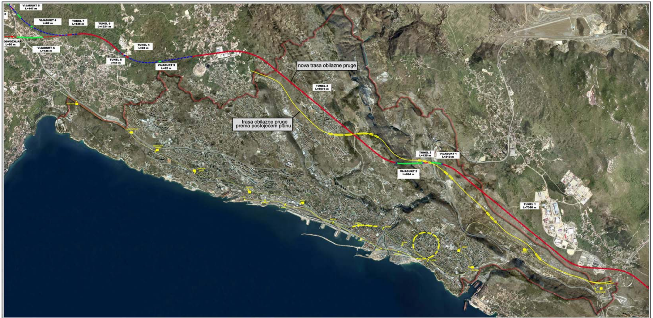
Slika 3. Usporedni prikaz trasa obilazne željezničke pruge visoke učinkovitosti