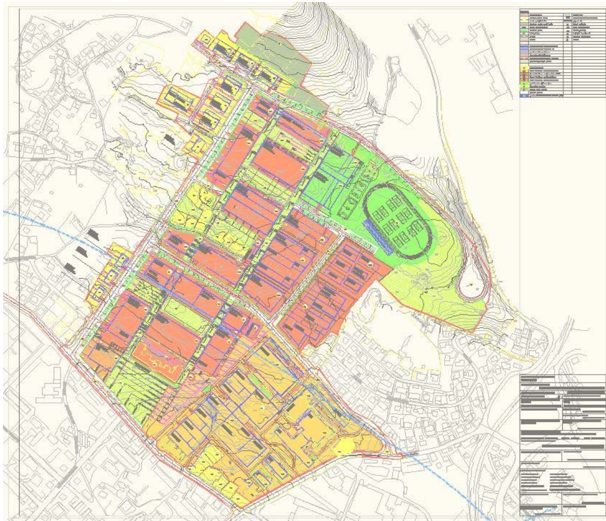
SLIKA 3. – Detaljni urbanistički plan područja Sveučilišnog kampusa i Kliničkog bolničkog centra na Trsatu (SN PGŽ 29/05) – Broj grafičkog prikaza 1.– Detaljna namjena površina

U vremenskom razdoblju od donošenja Plana do danas, na nerealiziranim dijelovima Plana ukazuje se potreba za dodatnim intervencijama u prostorno-planskoj dokumentaciji kako bi se izvršila nužna usklađenja za privođenje cjeline namjeravanim funkcijama, a u skladu sa suvremenim zahtjevima i planskim projekcijama.