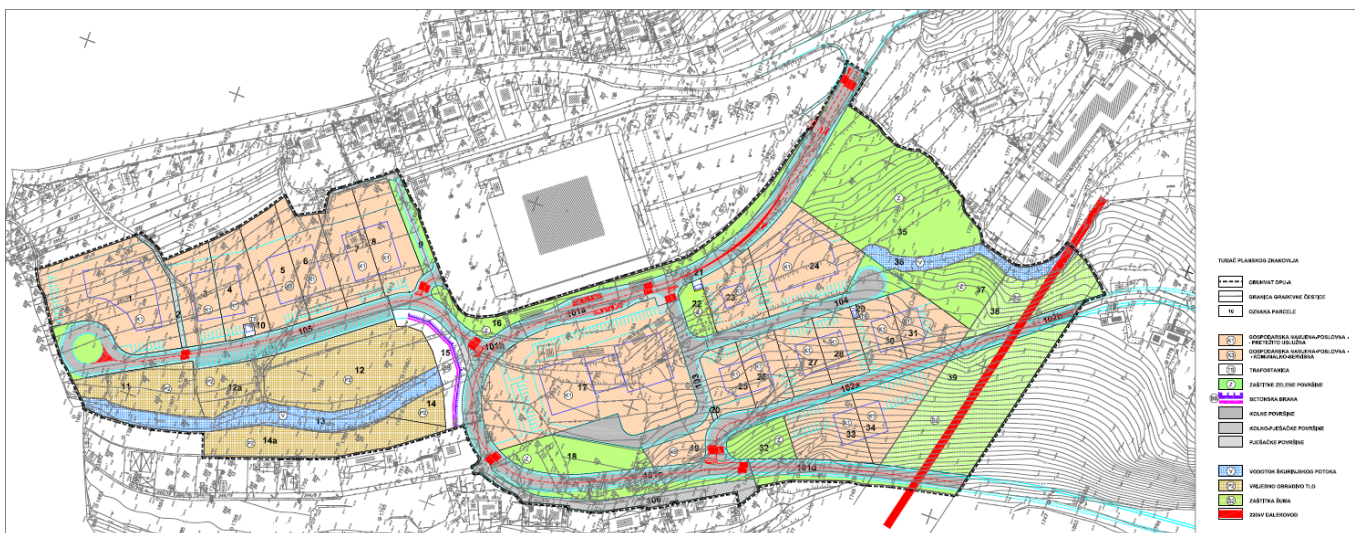
Izvod iz kartografskog prikaza br.1. Detaljna namjena površina DPU trgovačkog i uslužnog područja – radna zona Bodulovo