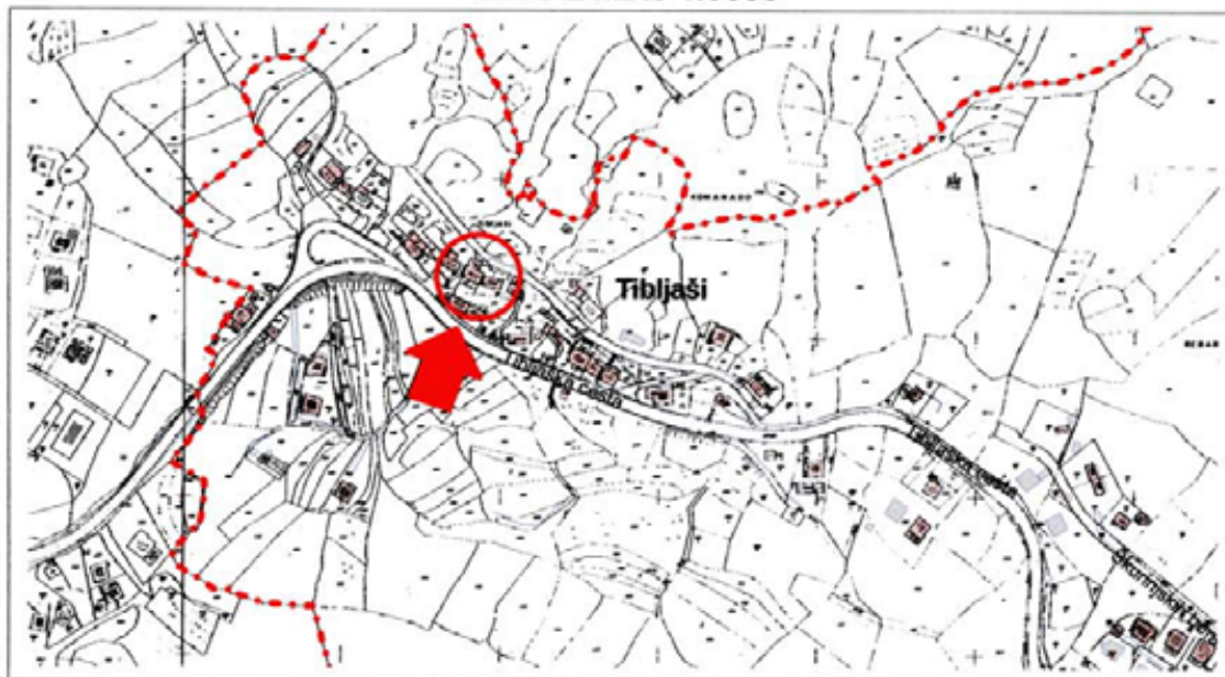
Izvod iz karte 1:5000