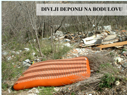
DIVLJI DEPONIJ NA BODULOVU

Povodom 22.travnja, dana Planete Zemlje Vijeće MO odbora organizirat će ekološku akciju čišćenja. Akcija će se održati 19. ili 20. travnja, zavisno o vremenskim prilikama. Na području MO postoji više lokacija, koje „vape“ za čišćenjem, Pozivamo Vas da se prijavite se za sudjelovanje u Tajništvu MO na tel 268 100.ili predložite mjesto čišćenja.