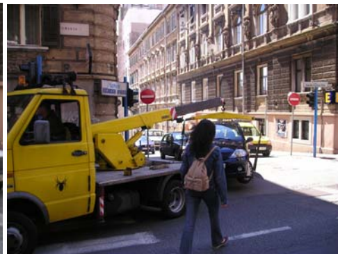
Fotografije snimljene u ulici Slaviše Vajnera Čiče

Slike dovoljno govore same za sebe, ali treba istaknuti i nedavni slučaj u gornjem dijelu ulice Slaviše Vajnera Čiče gdje su nepropisno parkirani automobili zapriječili prolaz vatrogasnom vozilu.