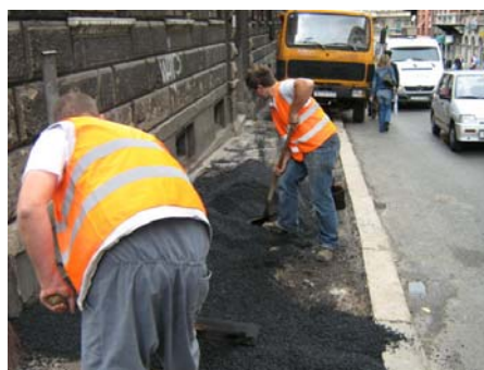
Fotografije snimljene tijekom sanacije nogostupa u Ulici Fiorello la Guardia

Kao prijedlozi komunalnog opremanja i uređenja koje mora odobriti Odjel gradske uprave za komunalni sustav Grada Rijeke, za 2008. godinu prijedlozi su Mjesnog odbora Brajda-Dolac: