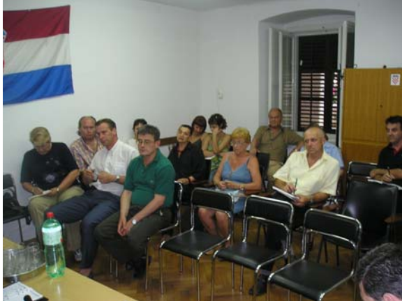
Predstavnici nadležnih službi i građana na sastanku

Zbog loše zvučne izolacije kao i izbacivanja zvučnika na terase, čime se onemogućuje normalan noćni odmor građana, organizirano je nekoliko sastanaka na kojima su bili prisutni i članovi Poglavarstva Grada Rijeke, uključujući i zamjenika gradonačelnika g. Đanija Poropata.