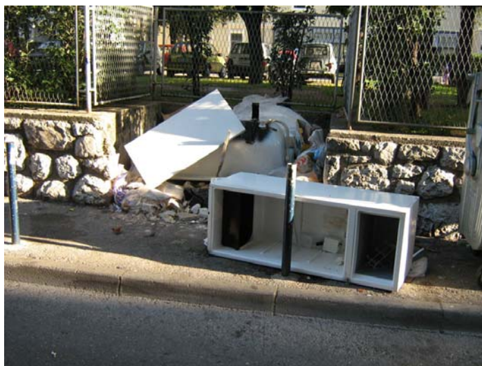
Odbačeni krupni otpad u ulici Ivana Filipovića

Pozivamo građane da naručivanjem baja preko mjesnog odbora smanje požarnu opasnost u zgradama u kojima žive, a da krupni otpad ne odlažu na ulicama.