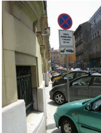
Ulica Frana Kurelca

Bezobrazluk brojnih vozača nema granica: uobičajena je slika parkiranje na nogostupima i zaprečavanje prolaza pješacima.