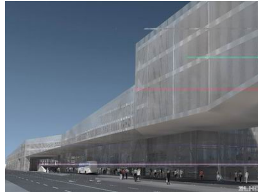
Budući izgled putničkog terminala na Zapadnoj Žabici

Do današnjeg dana Vijeću Mjesnog odbora Brajda-Dolac nije se obratio nijedan građanin s područja mjesnog odbora Brajda-Dolac koji je protiv izgradnje autobusnog kolodvora ili protiv rušenja starih željezničkih skladišta, dapače, iz usmenih spoznaja možemo reći kako građani ovog dijela grada žele što bržu izgradnju autobusnog kolodvora jer smatraju kako je sadašnji izgled cijelog tog područja neprimjerenog izgleda.