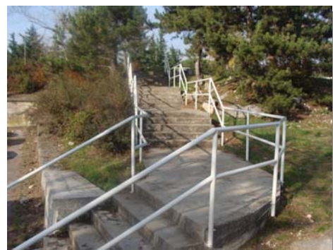
Stepenište u Ulici Ružice Mihić

Prema planu prioriteta za 2009. godinu u mjesecu lipnju na području MO Drenova realizirani su radovi u Ulici Brune Francetića kod kućnog broja 22, 32a, 32b, 32c i 37. Izvođač radova je tvrtka "Ceste" Rijeka, a ukupna vrijednost radova iznosi 63.571,00 kuna.