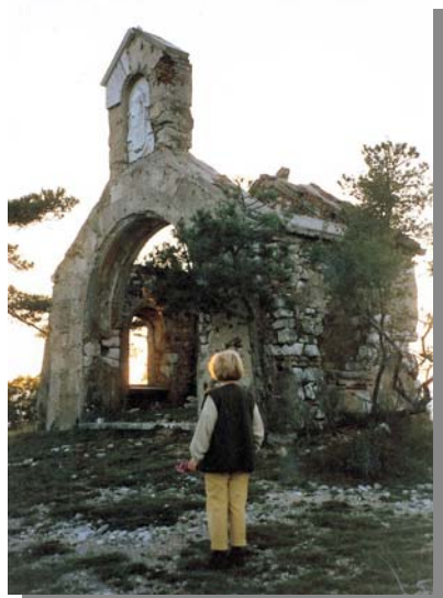
Kapelica prije obnove

U dnevnim novinama " LA VEDETTA D'ITALIA" koje su u Rijeci izlazile svakodnevno, oko tih datuma iz travnja 1942. godine nema nikakvih zapisa o takvom događaju, što bi svakako bilo zabilježeno uz tako važnog govornika, kao što je general Roata (zapovjednik 2. Talijanske armije, nakon rata osuđen za ratni zločin). Ali zato imamo obavijesti o proslavama i dobrim željama Adolfu Hitleru za njegov 53. rođendan (20.04.1942.), zatim informaciju da je u Talijanskom nogometnom prvenstvu Fiume (Rijeka) pobijedila Treviso 2:1 i to u