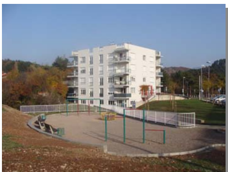
Novo dječje igralište