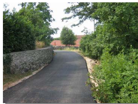
Kuzminački put b.b.