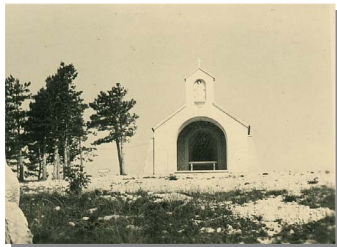
Kapelica neposredno nakon izgradnje

Jedan nedavno preminuli Drenovčan, rođ. 1909. također je svojevremeno, baš u doba kada je tema obnove zaintrigirala puk, po svom sjećanju (postoji zabilježba) također dao izjavu, iz koje proizlazi: Blagoslov kapele bio je u proljeće 1942. godine, kišilo je. Tih je dana (možda i isti dan) također na prostoru između kapele i vojne zgrade (sada skladišta, u to doba vojarne, a nekoć, u početku lugarske kuće) pokopan jedan vojnik, čiji su posmrtni ostaci kasnije ekshumirani i prenijeti. Nije poginuo na tom prostoru. Također, isti je gospodin izjavio i nekoliko interesantnih detalja vezanih za Veli vrh. Po njegovom sjećanju i priči, koju je čuo od starijih ljudi, u vremenu od 1909.-1919. godine na prostoru Velog vrha vršena su iskapanja kamena, koji se koristio za obnovu i ugradnju u Guvernerovu palaču i u Kapucinsku crkvu (pogotovo kameno podnožje-cokul, oko crkve).