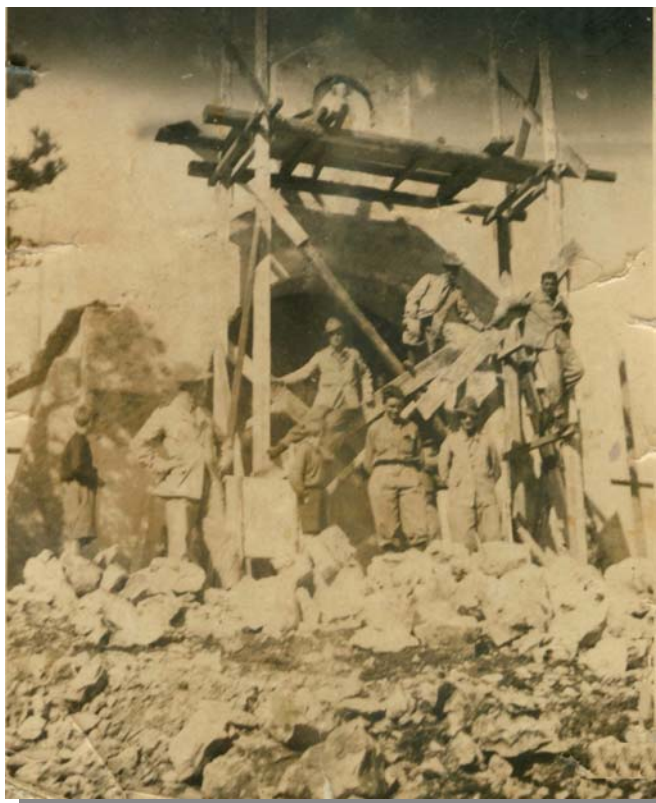
Kapelica u izgradnji

Sve do kasnog ljeta 1997. godine za Veli vrh znali su samo zaljubljenici u prirodu. Tamo su pohodili, diveći se prekrasnom krajobrazu, ostatku nekadašnjeg preoptimistično nazvanog i nikada saživljenog "Arboretum Litorale Hungaricum" (Arboretum Mađarskog primorja) s još uvijek živim primjercima Španjolske jele (prorijeđene čak i u Španjolskoj). Brali su gljive i zakonom zaštićene biljke. Redoviti posjetitelji i sada i onda, bili su također i neumorni penjači, koji marljivo vježbaju na strmim liticama Velog vrha, biciklisti, koji su čak i klub nazvali Veli vrh, planinari i svi njima slični. Zaljubljeni su parovi također tamo nalazili sebi toliko potreban mir. Naravno da ima i onih "prijatelja prirode" koji su upravo tu (?) našli savršeno mjesto za odlaganje svog golemog otpada; istrošenih guma i odavno islužene bijele tehnike. Također, to je bilo i mjesto za "privremeni otpad" jednog renomiranog građevnog poduzeća s kvarnerskog otoka, o čemu je svojevremeno pisao i Novi list. I uz tvrtku koja tamo redovito održava svoj okoliš skladišta opasnih tvari, primjereno ograđen visokom bodljikavom žicom, to je bilo uistinu jedno idilično i nadasve mirno mjesto.