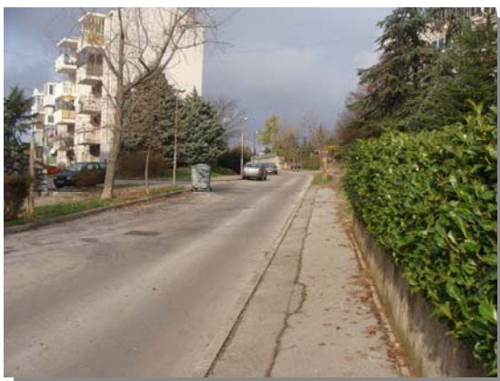
Ulica Ružice Mihić