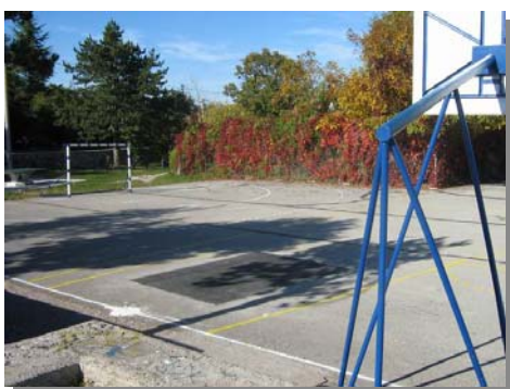
Igralište na Tuniću