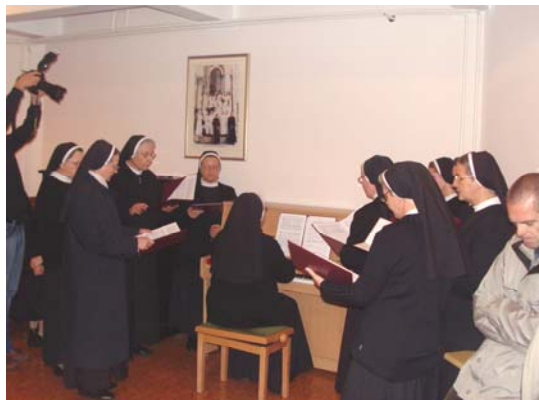
Zbor sestara samostana

Družba sestara Presvetog srca Isusova i Riječko filatelističko društvo organizirali su 25. studenoga, u Kući matici predstavljanje prigodnog žiga i prigodne omotnice u povodu obilježavanja 120. obljetnice karitativnog djelovanja Majke Marije Krucifikse Kozulić, utemeljiteljice jedine autohtone riječke Družbe sestara Presvetog srca Isusova i 110. obljetnice Družbe.