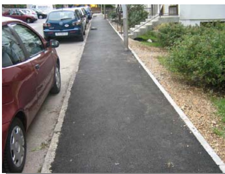
Saniran pločnik, Frkaševo