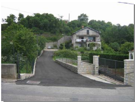
Brune Francetića 32 A,B,C