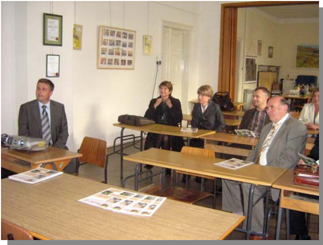
Susret predstavnika Osijeka, Pule, Šibenika i Rijeke

Iako ponekad izgleda da smo vrlo često u „sukobu“ s gradskom upravom - pokazuje se da naš argumentirani nastup i borba za bolju poziciju mjesne samouprave i uvažavanje mjesnih odbora ipak nailazi na odobravanje.