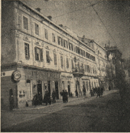
Rijeka. Bivša hrvatska gimnazija