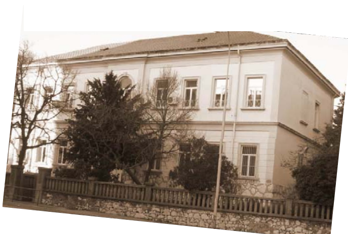
Dječji vrtić (ex. Pučka škola) – 1914.