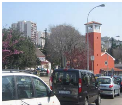
Redovna slika prometnog kaosa kod crkve

Iako MO Podvežica iz svojih sredstava ne može financirati uređenje prostora ispred naše župne crkve, stanje na ovome mjestu toliko je kaotično da o ovome niti možemo niti smijemo šutjeti. Isprepliću se ovdje različite nadležnosti (Županijska uprava za ceste, Grad Rijeka...), potrebna su posebna prometna i urbanistička rješenja...i tomu slično.