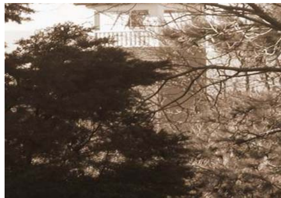
Zvonik župne crkve izgrađene 1940.