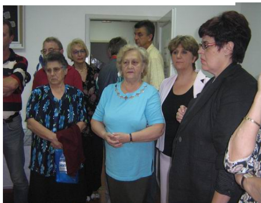
Slika 2 – Gužva na ulazu zbog velikog interesa za izložene radove