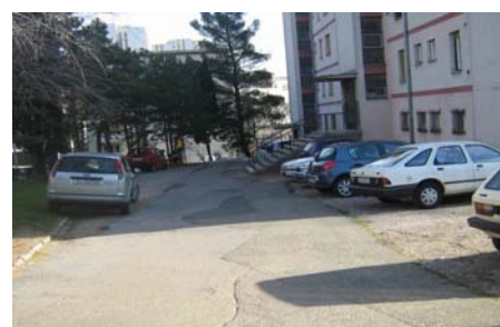
J.Grabovšeka 8 i 8a