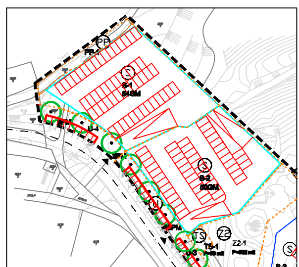
PROMETNO RJEŠENJE PODZEMNE ETAŽE - GARAŽE NA G.C. OZNAKE S-1 I S-2