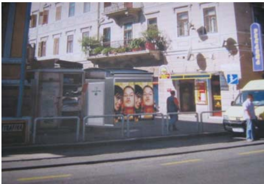
Simulacija automatskog javnog zahoda na lokaciji kod pothodnika

Potom kreće inicijativa Odjela gradske uprave za komunalni sustav o postavljanju automatskog javnog zahoda na lokaciju iznad pothodnika, kod zgrade Vatroslava Lisinskog 2.