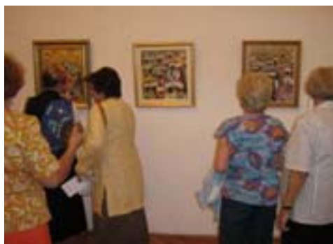
Zainteresirani posjetitelji izložbe