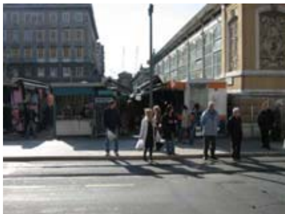
U Trnininoj ostaju samo kiosci s cvijećem

U istočnom dijelu Zagrebačke ulice oslobađa se sredina ulice, uklanjaju se drveni stolovi pa prohodnost postaje bolja, naročito za stanare Zagrebačke 9-13.