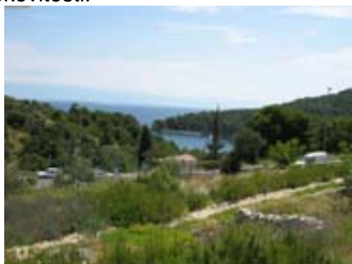
Pogled na more iz Miomirisnog otočnog vrta

Dočekani smo pićem dobrodošlice likerom od mirte i sokom od mente (jako ukusno! op.a.), a onda se uputili u obilazak vrta pa smo, vođeni stručnim uputstvima, upoznali smo biljke kraj kojih smo do sada prolazili, a da nismo znali skoro ništa o njima.