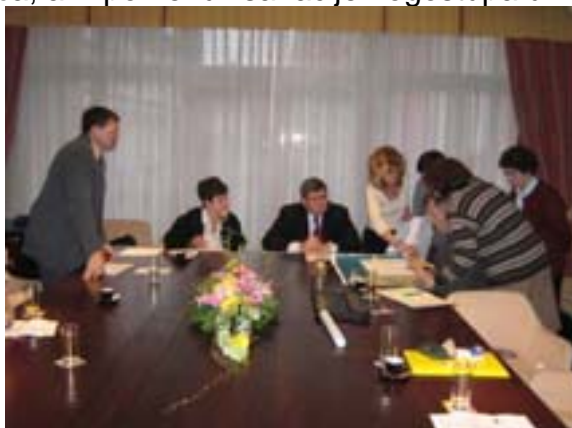
Sastanak s Gradonačelnikom Vojkom Obersnelom

Prometne probleme rješavali smo u suradnji s predstavnicima temeljne i prometne policije, "Rijeka prometa" i komunalnog redarstva na kojima smo dogovorili organizaciju parkiranja na taj način da bi ulice bile prohodnije, potaknuli postavljanje stupića radi zaštite stupića, ali i pokrenuli sanacije nogostupa u Zagrebačkoj, Demetrovoj i Ulici Matije Gupca.