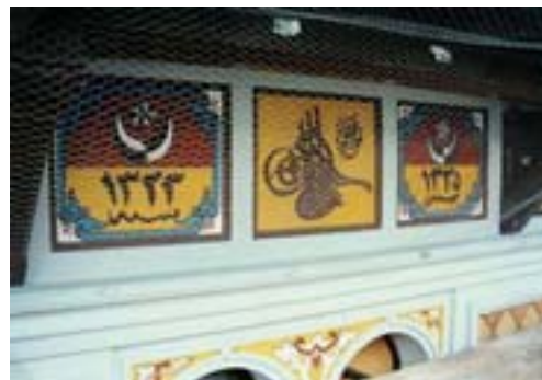
Neki od ukrasa na Turskoj kući

Dogradio je četvrti kat zgrade te je ukraasio orijentalnim ukrasima i natpisima na arapskom jeziku.