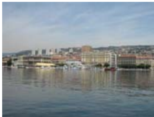
Pogled s Riječkog lukobrana na voljeni grad