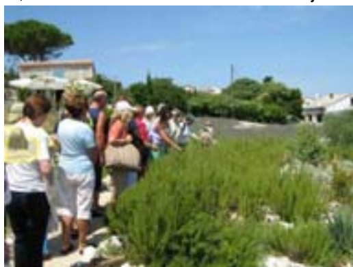
Upoznavanje s ljekovitim biljkama

Dočekani smo pićem dobrodošlice likerom od mirte i sokom od mente (jako ukusno! op.a.), a onda se uputili u obilazak vrta pa smo, vođeni stručnim uputstvima, upoznali smo biljke kraj kojih smo do sada prolazili, a da nismo znali skoro ništa o njima.