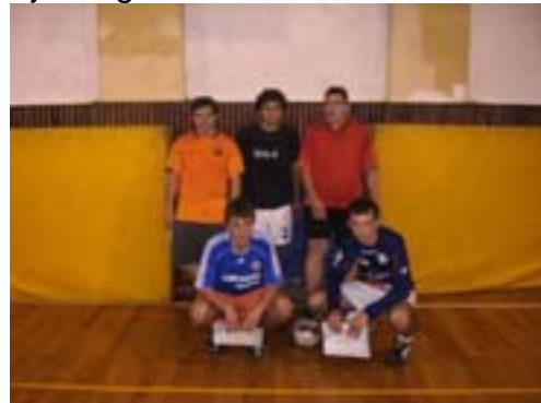
Pobjednička ekipa "Nas pet"

Utakmice su bile izuzetno zanimljive, a moglo se tu vidjeti i poteze dostojne prvoligaških nogometnih terena.