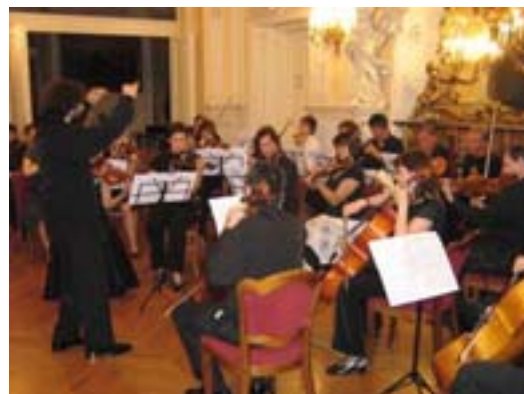
Riječki komorni orkestar