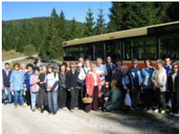
Izlet u Ravnu Goru

Pododbor za zdravi život misli na svoje sugrađane te im barem jednodnevnim izletima nastoji omogućiti jednodnevan odmor od gradske buke i prometnog mravinjaka te smo organizirali izlete u Ravnu Goru, u Krasno i Kuterevo te na Mali Lošinj.