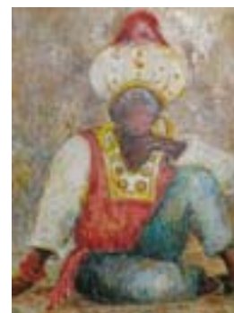
L. Ličen: "Morčić"