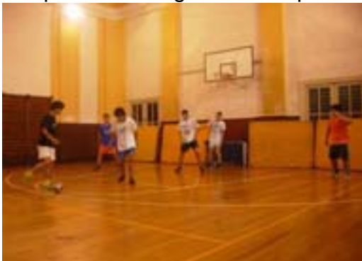
Detalj s nogometnog turnira

Turnir je održan u dvorani ŠRC "Sušak" u Ružičevoj ulici, a među sudionicima turnira bile su prisutne i 3 ekipe mladih nogometaša s područja Mjesnog odbora Luka.