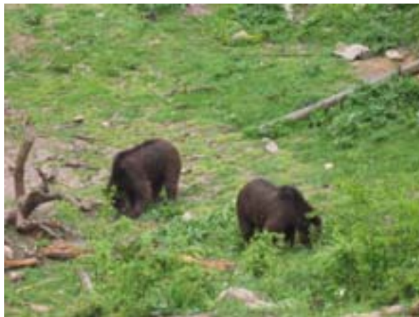
Medvjedići u Kuterevu

Što se tiče brige o najmlađima, tradicionalno smo darivali djecu predškolskog uzrasta poklonima Djeda Mraza, a cijelu smo podjelu i snimali te je svako dijete na poklon za uspomenu dobilo fotografiju i DVD sa snimkom podjele darova.