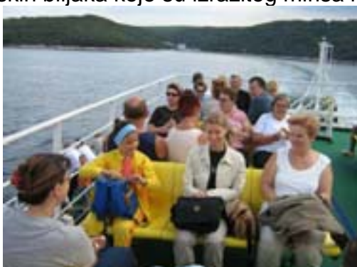
Na trajektu Valbiska-Merag

U Malom Lošinjju posjetili smo Miomirisni otočni vrt u kojemu je posađeno 65 mediteranskih biljaka koje su izrazitog mirisa i ljekovitosti.