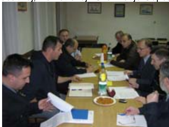
Sastanak vezan uz prometne probleme

Uskoro će započeti nastavak radova na uređenju partera oko Kazališnog parka u dijelu Verdieve ulice od broja 9 do 11 te partera oko zgrade HNK Ivana pl. Zajca koji će bitno, i to na bolje, promijeniti izgled ovih ulica.