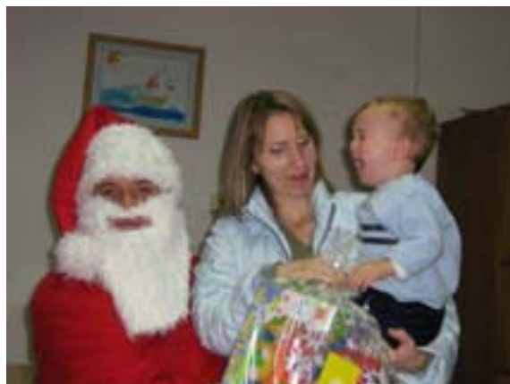
Podjela darova Djeda Mraza u prostorijama Mjesnog odbora Luka

Četvrtu godinu zaredom organiziramo i "Likovni susret u Jedrarskoj" koji ima svoje redovno mjesto u kalendaru likovnih događanja, pohode ga redoviti sudionici iz Rijeke, ali i djeca iz cijele Primorsko-goranske županije.