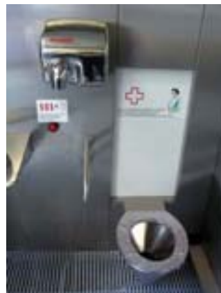
Izgled unutrašnjosti automatskog javnog zahoda