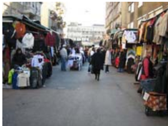
"Prazni" se sredina Zagrebačke ulice od štandova

Problemi čišćenja rješavat će se s novim (starim) koncesionarom, zatražen je nadzor čišćenja te osnivanje fonda za sanaciju oštećenja zgrada nastalih uslijed čišćenja tržnice. Kada nam je tržnica već u susjedstvu, želimo je čistu i lijepu.