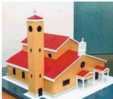
Slika objavljena u Novom listu 31. ožujka 2008.