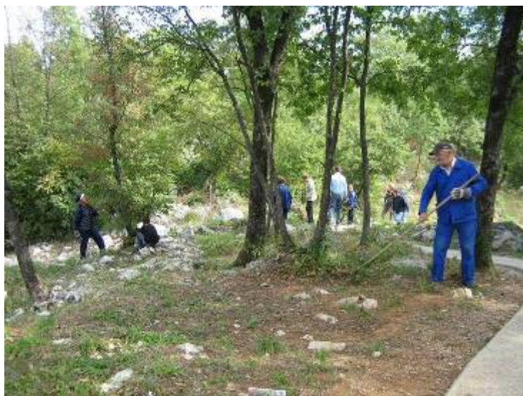
Čišćenje okoliša škole