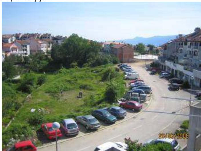
Livada prije uređenja

Eto, uz malo dobre volje i entuzijazma može se puno toga učiniti. Godinama je u Ulici A.B.Šimića – naselje popularnog naziva "Mala Florida" postojala neuređena i obrasla gradska površina. U toj ulici živi brojna populacija djece od 1 - 17 god. koja nisu imala svoju površinu za sigurno igranje već su veći dio vremena provedenog u igri provodili na sve prometnijoj ulici.