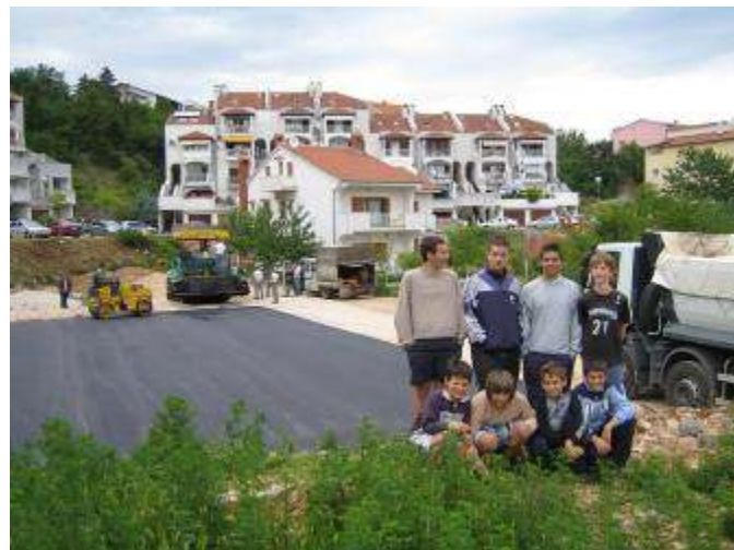
Dio ekipe malih volontera

Nakon završenog asfaltiranja, djeca su u okolišu zgrade na raznim lokacijama pronašla potreban materijal za izradu drvenih golova, kako bi igra mogla odmah započeti. Tih je dana "starije" stanare iznenadio je broj djece i ljudi koji su se odjednom počeli okupljati, družiti i igrati na novouređenom igralištu.