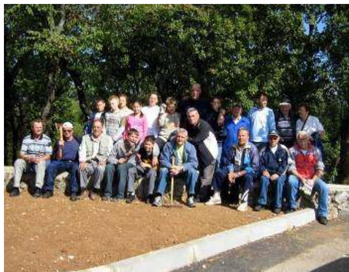
Dio ekipe volontera