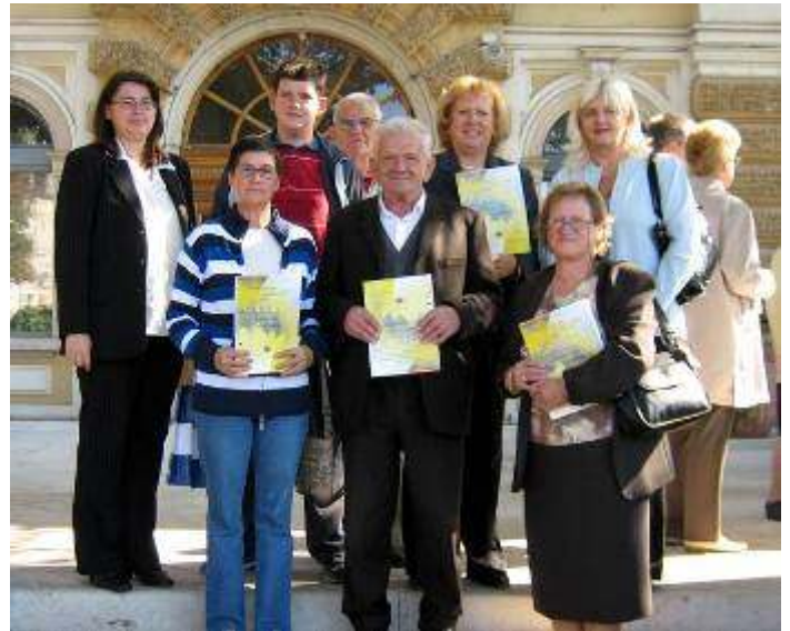
Neki od sudionika akcije s tajnicom MO Srdoči

Ove hvale vrijedna priznanja dobivena su zahvaljujući uspješno organiziranoj akciji "Birajmo najljepšu okućnicu i balkon" i održavanju tradicionalne ekološke akcije "Da Srdoči blistaju".