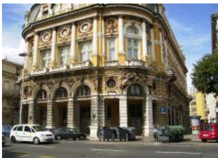
Baje su premještene 20-ak metara udesno

Sada su baje premještene u Demetrovu ulicu. Još se radi na rješenju gdje bi bilo najbolje mjesto za smještanje baja u Demetrovoj ulici.