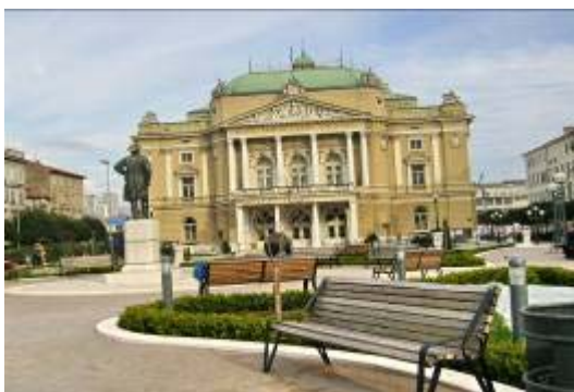
Zlatko Leporić, Član uredništva „Bulletina”

Stoga prvenstveno mi stanovnici kvarta svojim ponašanjem i zahtjevima moramo pokazati u kakvom okruženju želimo živjeti.