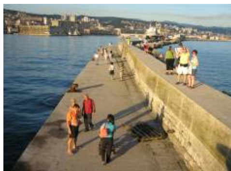
Pogled na voljeni grad sa lukobrana

Kada sam već došao do kraja lukobrana moram se popeti na svjetionik