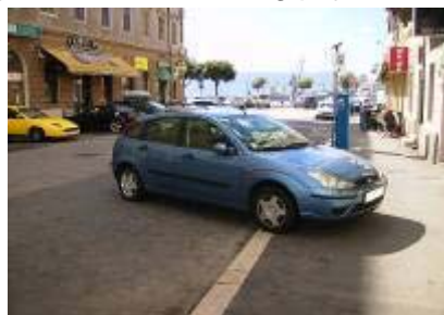
Nema veze što nema nikoga ja ću parkirati baš ovako!

U slučaju da „Rijeka promet“, Policija i Odjel gradske uprave za komunalni sustav u Zagrebačkoj ulici ne mogu dovesti u red nepropisno parkirana vozila Vijeće MO Luka zahtjeva postavljanje stupića na nogostup od prvih prodajnih mjesta do spoja sa ulicom Riva Boduli (do „Mornara“).