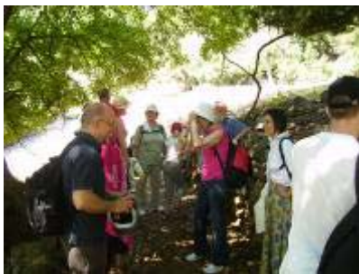
4 – satna šetnja Cresom