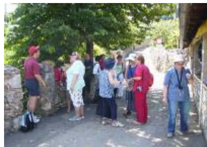
Mi smo za supove

Oduševljeni izletnici na povratku u Rijeku najbolja su nam pohvala. A to je ujedno i najbolji odgovor onima koji tvrde da „Mjesni odbori nisu turističke agencije da organiziraju izlete”.