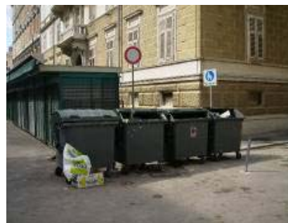
Baje su premještene u Demetrovu ulicu

Vijeće MO Luka zatražilo je od KD „ Čistoća” češće i kvalitetnije pražnjenje baja na našem području. Nakon toga poduzete su i određene akcije sa njihove strane gdje je zadužena osoba koja kontrolira baje i poziva kamion da isprazni prekrpane baje. I dalje će se nadzirati rad redovitog odvoza smeća gdje i od Vas očekujemo dojavu o eventualnim propustima.