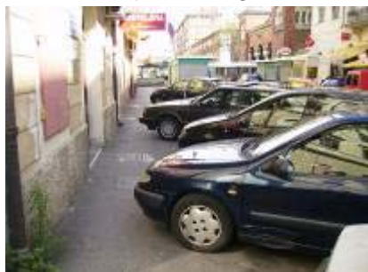
Što reći na ovo ?

Nažalost život u centru grada ima svoje dobre i loše strane te se svi mi moramo prilagoditi trenutnoj situaciji i početi uvažavati jedni druge. A to smatramo i dijelom kulture svakog pojedinca.