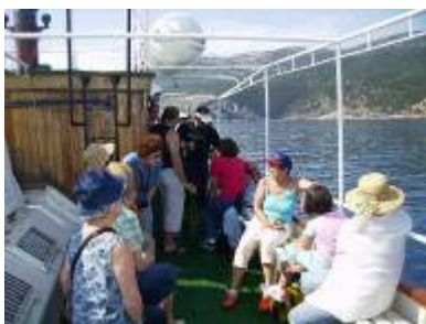
Upoznavanje na putu

Druga grupa se odlučila za posjet eko centru „Caput insolae” u kojemu im je održano predavanje o bioraznolikosti otoka Cresa i predavanje o bjeloglavim supovima. Nakon toga uputili su se na plažu u lučici i prepustili se blagodatima sunca i mora.