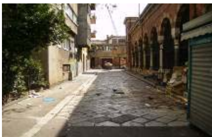
Prije postavljanja javnog WC-a

U svakom slučaju i u ovoj godini nastavljena je borba sa Gradskim odjelom za Komunalni sustav oko postavljanja javnog WC-a koji je na žalost sada postavljen u Trnininoj ulici. Unatoč prosvjedima, apelima i člancima u novinama. Traženo je da WC ne bude postavljen nikome pod prozor već na području gdje stanarima neće predstavljati smetnju a da istovremeno bude vidljiv i dostupan svima.