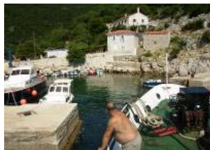
Ulazak u lučicu