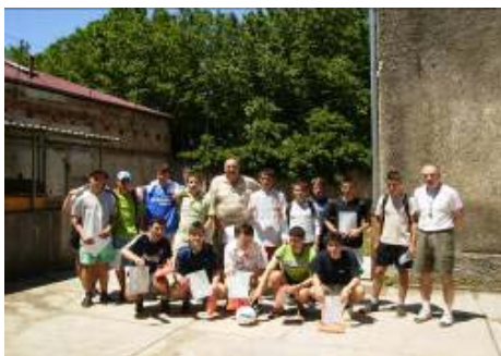
Zajednička fotografija za uspomenu

Još samo obavijest da se i dalje radi na ideji za postavljanje vanjskog montažnog igrališta za nogomet i košarku. Na žalost najveći problem je nedostatak slobodnog prostora.