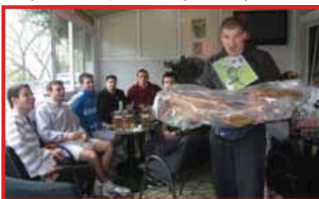
Pobjednici su proslavili uz pečeni odojka

* Prvo mjesto na turniru, pečeni odojka, pehar i priznanje osvojila je ekipa Istarski klub Rijeka * Drugo mjesto, pehar i priznanje osvojila je ekipa Miami * Treće mjesto, pehar i priznanje osvojila je ekipa MNK Ivan