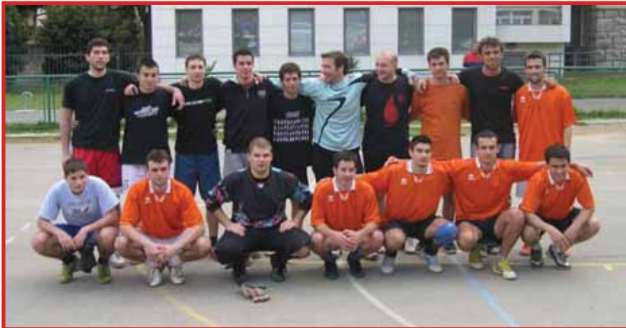
Pobjednička ekipa Istarskog kluba Rijeka

* Na Igralištu Medicinskog fakulteta u Rijeci, u organizaciji Vijeća Mjesnog odbora Banderovo, odigran je peti jubilarni Uskršnji turnir u malom nogometu Banderovo 2010.