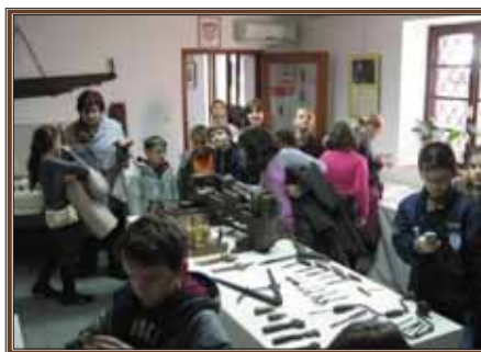
Učenici OŠ Dolac s pažnjom su pogledali izložbu

Izložba je nastala kao logičan nastavak prošlogodišnje pod naslovom "Približimo prošlost mladima" čija je priprema otkrila da na našem području ima vrijednih kolekcionara spremnih predstaviti svoju zbirku građanima, posebice mladima.