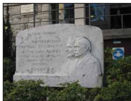
Reljef u kamenu s poprsjem braće Branchetta koji su pomogli da se zbrine ratna siročad i "oni koji su bez igdje ikoga"