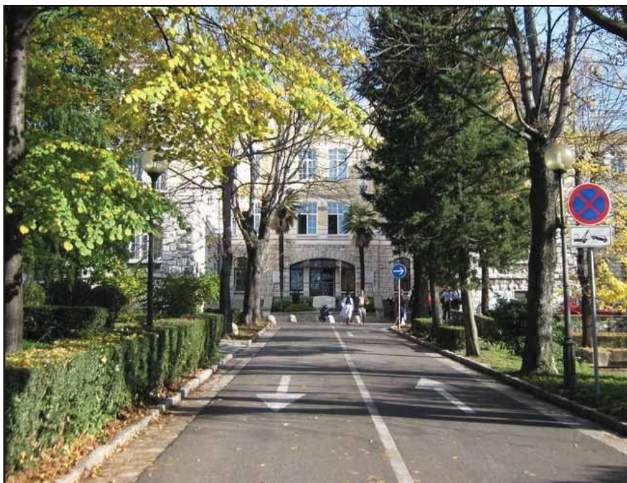
Cijeli kompleks s prelijepim parkom prostire se na površini većoj od 32 tisuće četvornih metara

Medicinski fakultet u Rijeci utemeljen je 21.XI 1955. godine. Bio je to prvi medicinski fakultet u Hrvatskoj nakon Zagreba. Prethodila mu je bogata povijest razvoja medicinske nauke i skrbi za siromašne i bolesne u Rijeci. Razvoj događaja oko zgrade Fakulteta može se promatrati sa dva aspekta - zgrade kao takve i sadržaja u njoj.