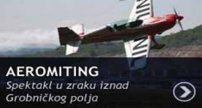
AEROMITING Spektakl u zraku iznad Grobničkog polja

Zahvaljujući činjenici da na području našeg Mjesnog odbora djeluje više klubova Zajednice tehničke kulture Rijeke, a na inicijativu Stojana Cerovca, pokrenuti su razgovori o mogućoj suradnji između MO Banderovo i te organizacije. Radio kluba "Rijeka" djeluje u Vukovarskoj 43A, dok je u Ulici Mire Radune Ban 14/3 sjedište više klubova Zrakoplovnog društva "Križa Kvarnera": jedriličarski, padobranski, pilotski, parajedriličarski, zatim Klub za samogradnju i