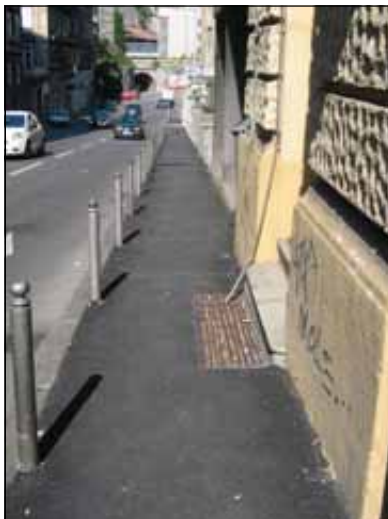
Ulica Ivana Grohovca