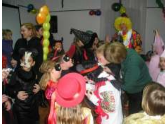
Foto priča pokazat će vam samo mali djelić atmosfere s ovogodišnjih tanci:

Kroz igru ( stolica, šampita, balona i karaoke ) prohujale su nam četiri subote ove godine, jer je vrijeme karnevala 2010. bilo kratko. A svaku pohvalu upućujemo učiteljicama OŠ Vežice gđi Loreni Brajković i Nataši Brumen Stijelja (bile su neumorne, opravdano su izostale jednu subotu, ali zamjenila ih je dostojno gđa Cvijeta Semijanac ).