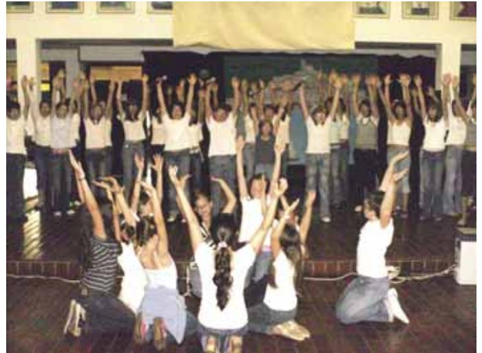
Sa svečane akademije

Učenici i djelatnici Osnovne škole "Fran Franković" obilježili su nizom prigodnih aktivnosti i događaja 20. obljetnicu rada u novoj školskoj zgradi.