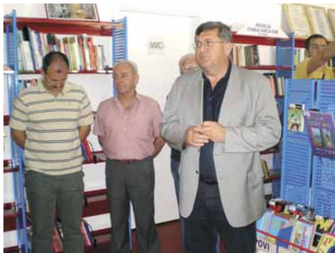
Prisutne je pozdravio gradonačelnik

Grupa predškolske djece iz Dječjeg vrtića Drenova razveselila je prisutne svojim recitacijama.