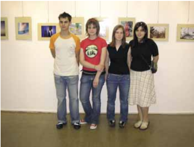
Autori fotografija na izložbi