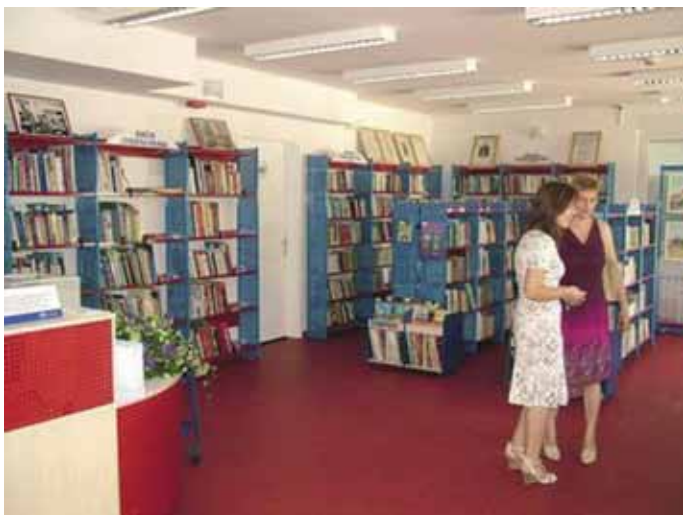
Dio nove knjižnice

Do sada su stanovnici Drenove koristili knjižnicu koja je od veljače 1985. godine bila smještena na adresi Cvjetna ul. 2, a s obzirom da je taj prostor postao premalen Gradska knjižnica Rijeka je uz pomoć Grada Rijeka kupila i uredila novi prostor veličine 159 metra četvorna.