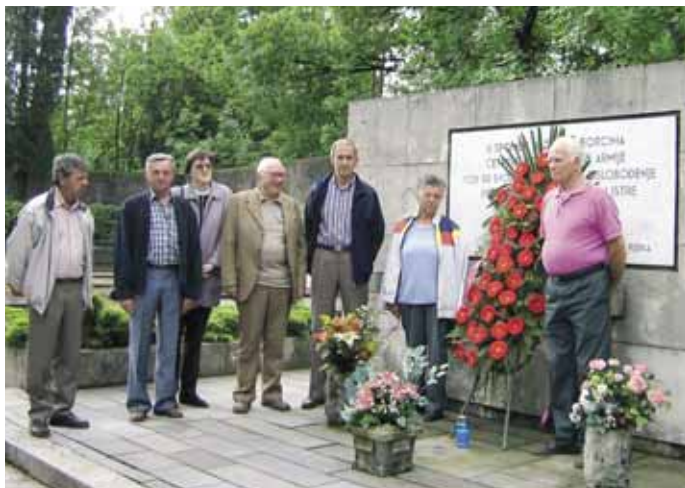
Pred spomen kosturnicom

22. lipnja prisustvovala je drenovska podružnica UABA proslavi Dana antifašističke borbe na Tuhobiću.