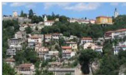
Pogled na Trsat i predio Bošket – 2014.

naselja odlazili na posao u Tvorničku ulicu (danas Ružićeva ulica). Izgradnjom izuzetno strmih stuba početkom 20. st. staza je izgubila svoj prvobitni značaj. Pri vrhu stube se račvaju u dva pravca, prema crkvi Sv. Jurja i prema Hrvatskoj čitaonici Trsat.