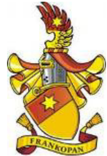
Stari grb knezova Krčkih (prije 1430.)

Pristajanjem uz ugarsko-hrvatskog kralja Belu IV. izgubili su kneštvo i prelaze na kopno u kraljevu