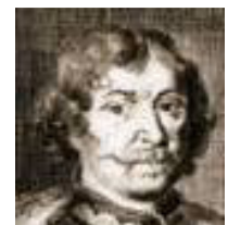
Vuk Krsto Frankopan