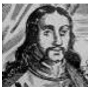
Fran Krsto Frankopan

Zajedno sa Petrom Zrinskim pogubljen je u Bečkom Novom Mjestu.