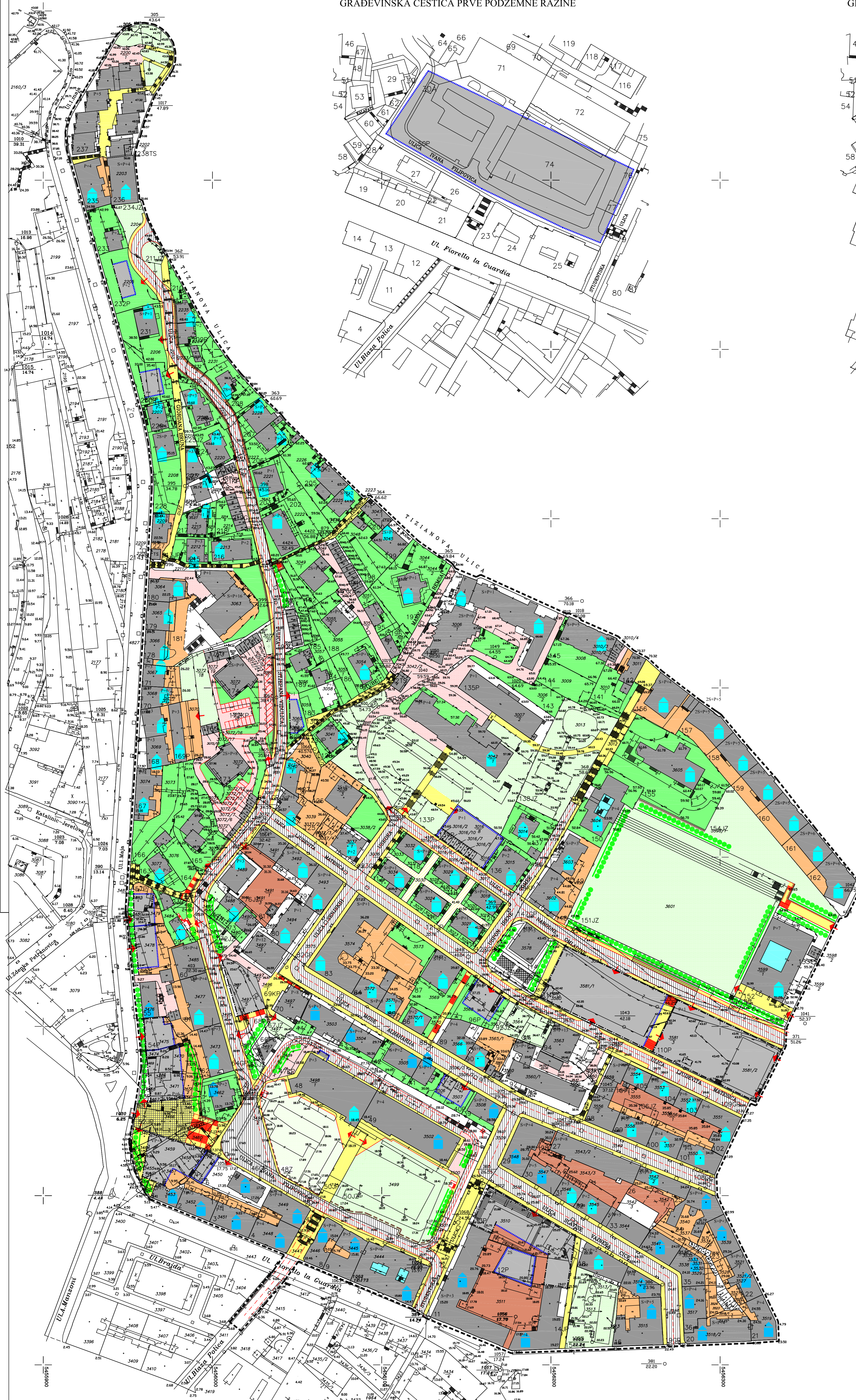
GRADEVINSKA ČESTICA ZADNJE PODZEMNE RAZINE