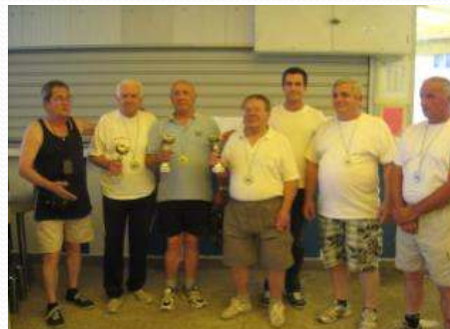
Nagrađeni kartaši (desno)