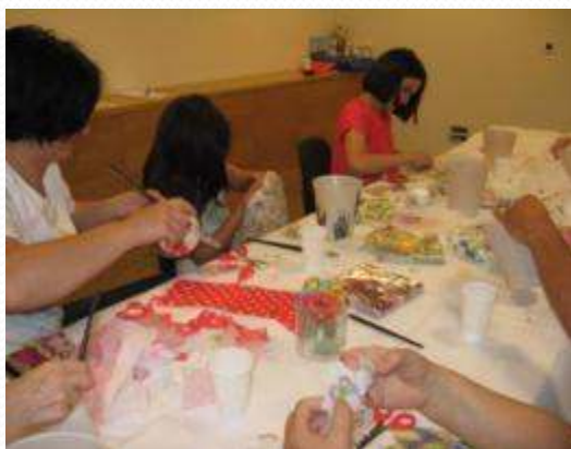
Kreativna radionica dekupaža