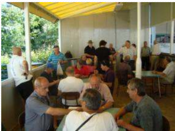
Boćari i kartaši u žaru igre