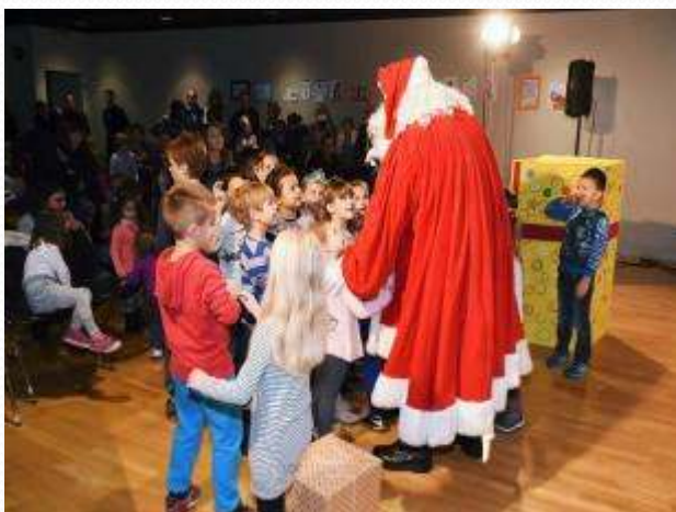
Prijatelji iz vesele kutije i Djed Mraz