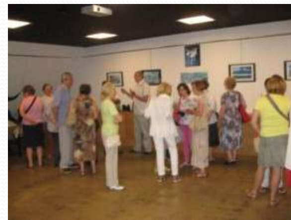
Izložba radova nastalih u kreativnim radionicama Matice umirovljenika