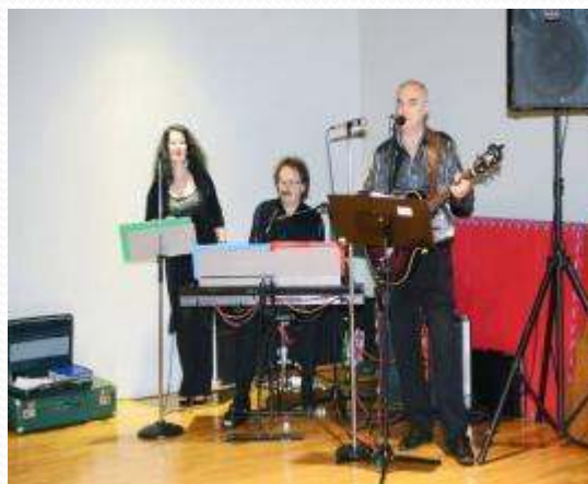
Nastup grupe Candys