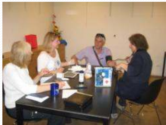
Mjerenje tlaka i šećera u krvi