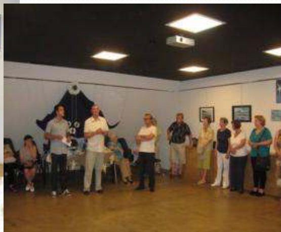
Izložba radova nastalih u kreativnim radionicama Matice umirovljenika