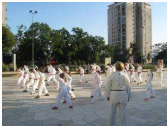
Karate klub Zamet – prezentacija vještina