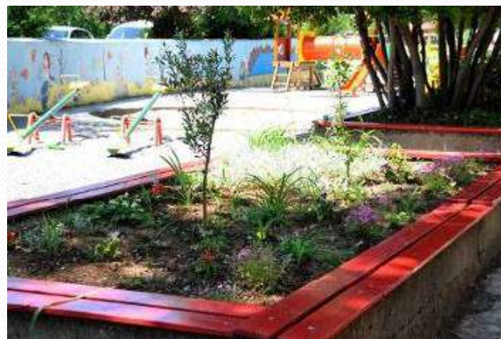
Nagrađene okućnice Dječjeg vrtića "Oblačić" –gore