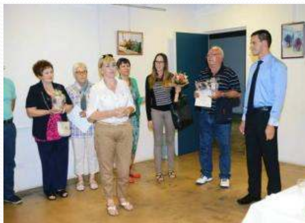
Izložba “cvijeće i vrtovi Zameta”