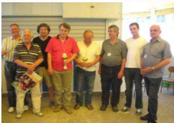
Nagrađeni boćari (lijevo)