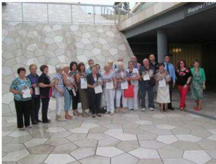
Zajednička fotografija učesnika akcije