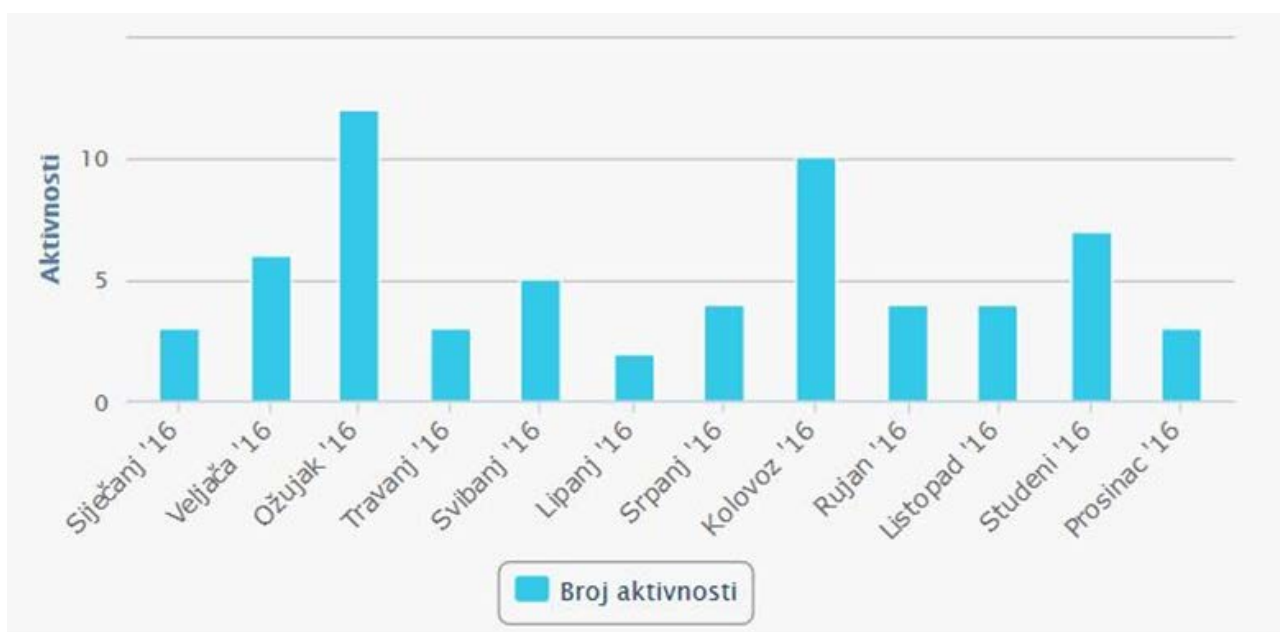
Grafikon 2. Prikaz svih intervencija po mjesecima

Sveukupno je tijekom 2016. godine izvršeno 63 akcije spašavanja i pružanja prve pomoći.