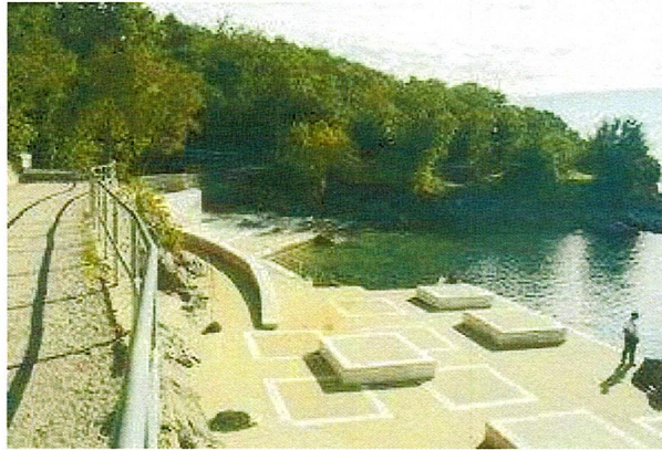
Slika 1: Postojeća plaža Kostanj

Uzdignuti plato s parkiralištem pred plažom prostire se na površini od 494 m 2 , a kopnena površina postojeće plaže iznosi 684 m 2 .