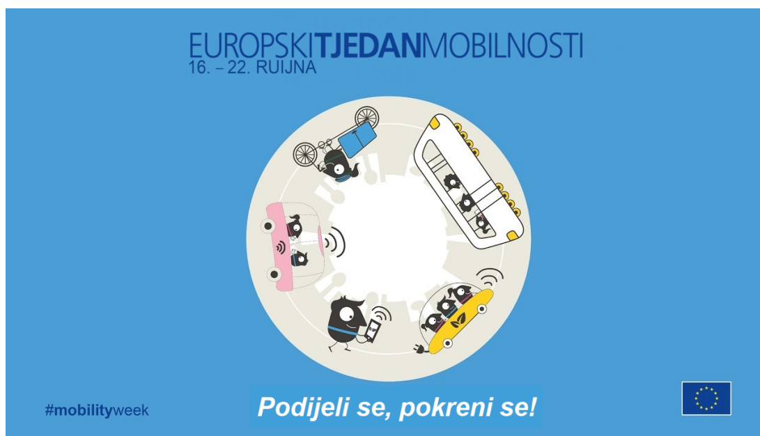
Slika 1: Ovogodišnji plakat

Budući da je cilj zatvaranja južnog dijela Ciottine ulice proširenje pješačke zone dio aktivnosti ovogodišnjeg programa će se odvijati u Ciottinoj ulici, a u njegovu realizaciju biti će uključeni i poduzetnici koji djeluju u tom prostoru.