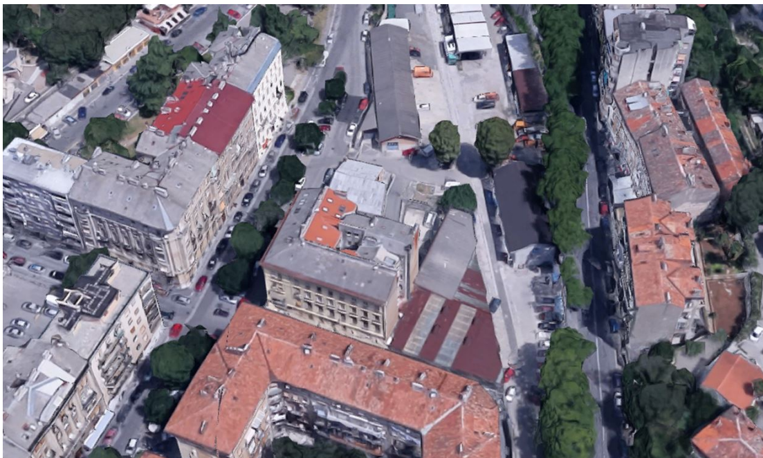
Prikaz 3. : Izgled lokacije 3, fotografija iz zraka

Lokacija 4 – ocjenjuje se da oblik i veličine čestice Plana oznake 42P s pripadajućim urbanističkim pokazateljima otežava realizaciju planirane izgradnje na toj lokaciji. Sadašnje stanje na lokaciji predstavlja zelena površina djelomično održavana od strane okolnih suvlasnika i stanara. Također je uočena neusklađenost planske namjene sa načinom korištenja zgrade na susjednoj čestici oznake 9b.