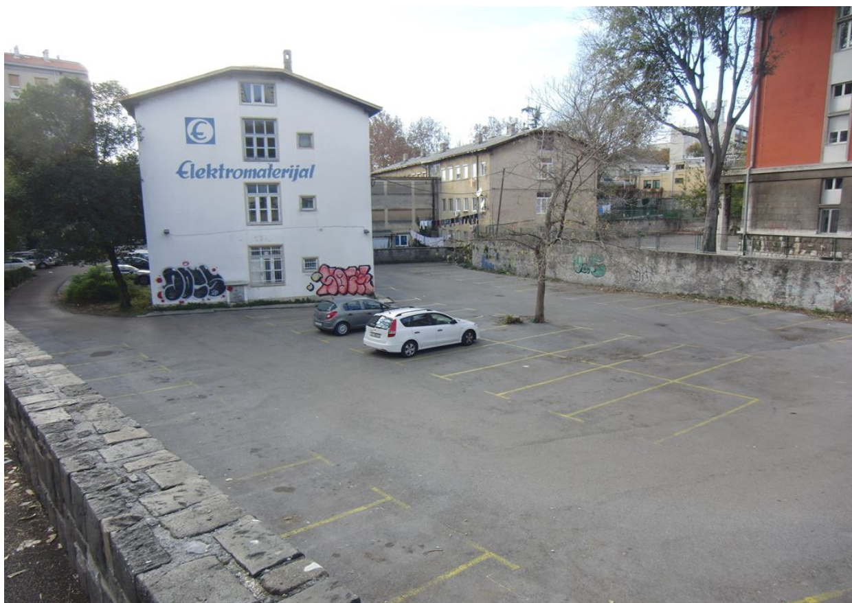
Prikaz 5. : Izgled lokacije 1

Na lokaciji se planira uklanjanje zgrada u kojima je djelatnost obavljalo ex. poduzeće „Elektromaterijal“ d.d., tj. uklanjanje istočne zgrade i spojne zgrade. Zapadna zgrada kompleksa zadržava se u prostoru, ali se na dijelu preostale neizgrađene površine planira gradnja nove zgrade mješovite – pretežito poslovne namjene ili gradnja zgrade hotela.