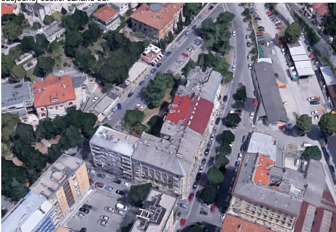
Prikaz 4. : Izgled lokacije 4, fotografija iz zraka

Lokacija 4 – ocjenjuje se da oblik i veličine čestice Plana oznake 42P s pripadajućim urbanističkim pokazateljima otežava realizaciju planirane izgradnje na toj lokaciji. Sadašnje stanje na lokaciji predstavlja zelena površina djelomično održavana od strane okolnih suvlasnika i stanara. Također je uočena neusklađenost planske namjene sa načinom korištenja zgrade na susjednoj čestici oznake 9b.