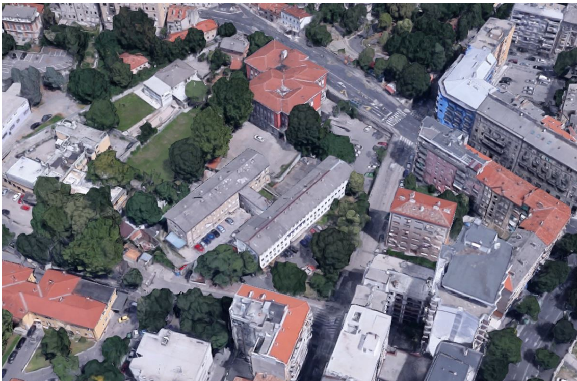
Prikaz 1. : Izgled lokacije 1, fotografija iz zraka

Lokacija 2 - ocjenjuje se da na građevnoj čestici Plana oznake 39 nije moguće ostvariti rekonstrukciju (nadogradnju) građevine oznake 39b bez nove provjere te mogućnosti sukladno zahtjevima tvrtke „Ri-ing“, d.o.o. koja planira rekonstrukciju (nadogradnju) zgrade;