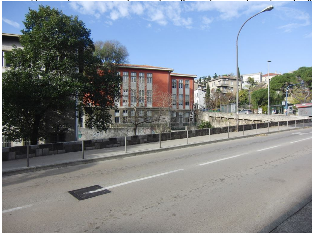
Prikaz 6. : Lokacija 1 – mjesto gdje se planira uređenje javnog trga

izgradnje privremenih ili trajnih objekata tipa kioska ili sl. Trg se planira urediti tako da se prilagodi denivelacijama okolnih ulica kako bi se u najvećoj mogućoj mjeri postigao kontinuitet pješačkih površina. Javna pješačka površina – manji ozelenjeni trg uređuje se i uz južno pročelje zgrade.