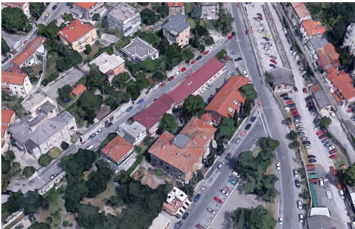
Prikaz 2. : Izgled lokacije 2, fotografija iz zraka

Lokacija 2 - ocjenjuje se da na građevnoj čestici Plana oznake 39 nije moguće ostvariti rekonstrukciju (nadogradnju) građevine oznake 39b bez nove provjere te mogućnosti sukladno zahtjevima tvrtke „Ri-ing“, d.o.o. koja planira rekonstrukciju (nadogradnju) zgrade;