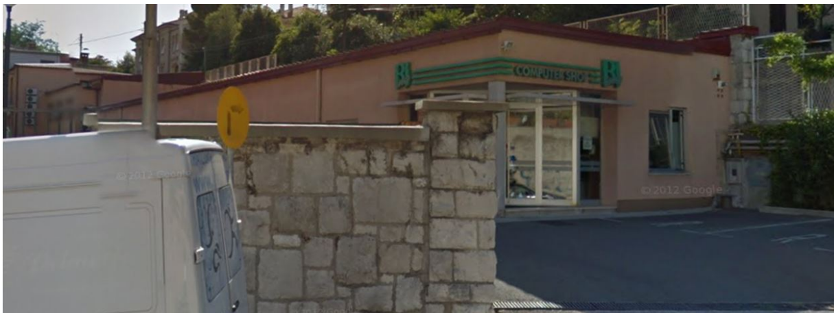
Prikaz 7. : Lokacija 2 – postojeća prizemnica