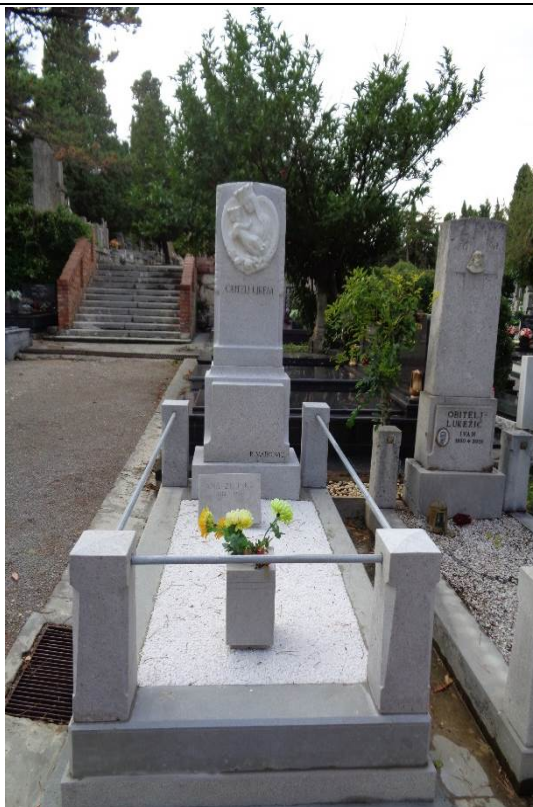
Grobnica obitelji Urem nakon radova, Groblje Trsat, 2018. godina

U nastavku se daje prikaz izvedenih radova najviše spomeničke vrijednosti: