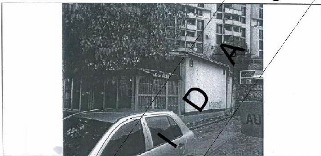
fotografija prikazuje stanje lokacije za postavu privremenog objekta iz jeseni 2009. godine