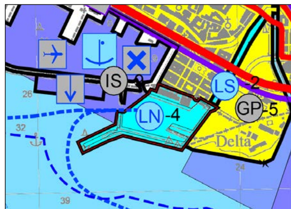
izmjene i dopune

4.2. na području Rujevice, smanjena je površina infrastrukturne namjene (IS) usklađena s izvedenom prometnicom GUIII.