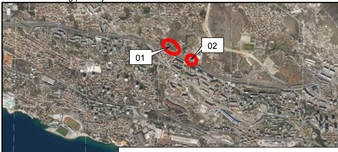
Kopija gruntovnog plana